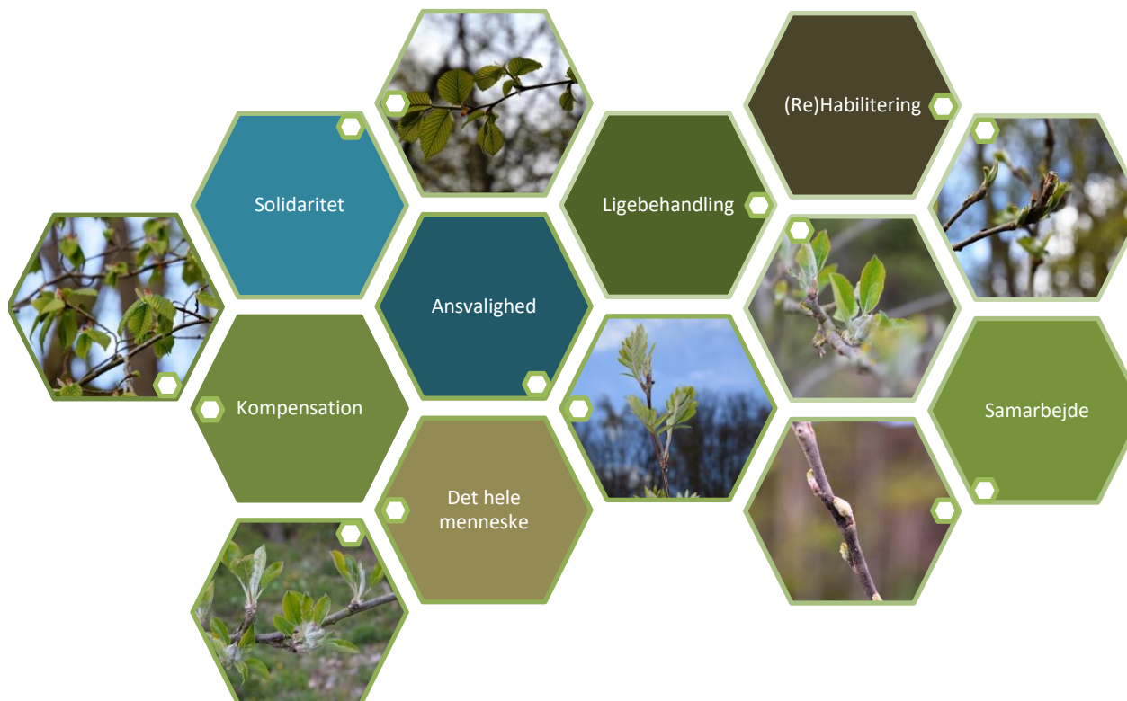
Principper og værdier i Handicappolitik 2023-2026

Løsningerne skal dermed tage afsæt i et konkret og individuelt skøn, for at sikre det enkelte menneskes unikke kvaliteter.