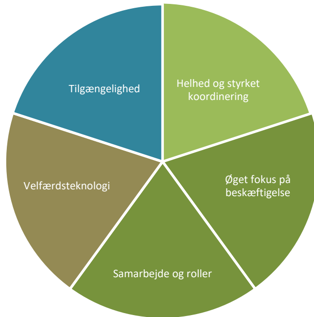
Prioriterede indsatsområder for Handicappolitik 2023-2026

Indsatsområderne i Handicappolitik 2023–2026 tager udgangspunkt i de beskrevne værdier og principper. Der er fem prioriterede indsatsområder, som giver et billede af de områder som Langeland kommune vil have særligt fokus på i opgaveløsningen i de kommende år.