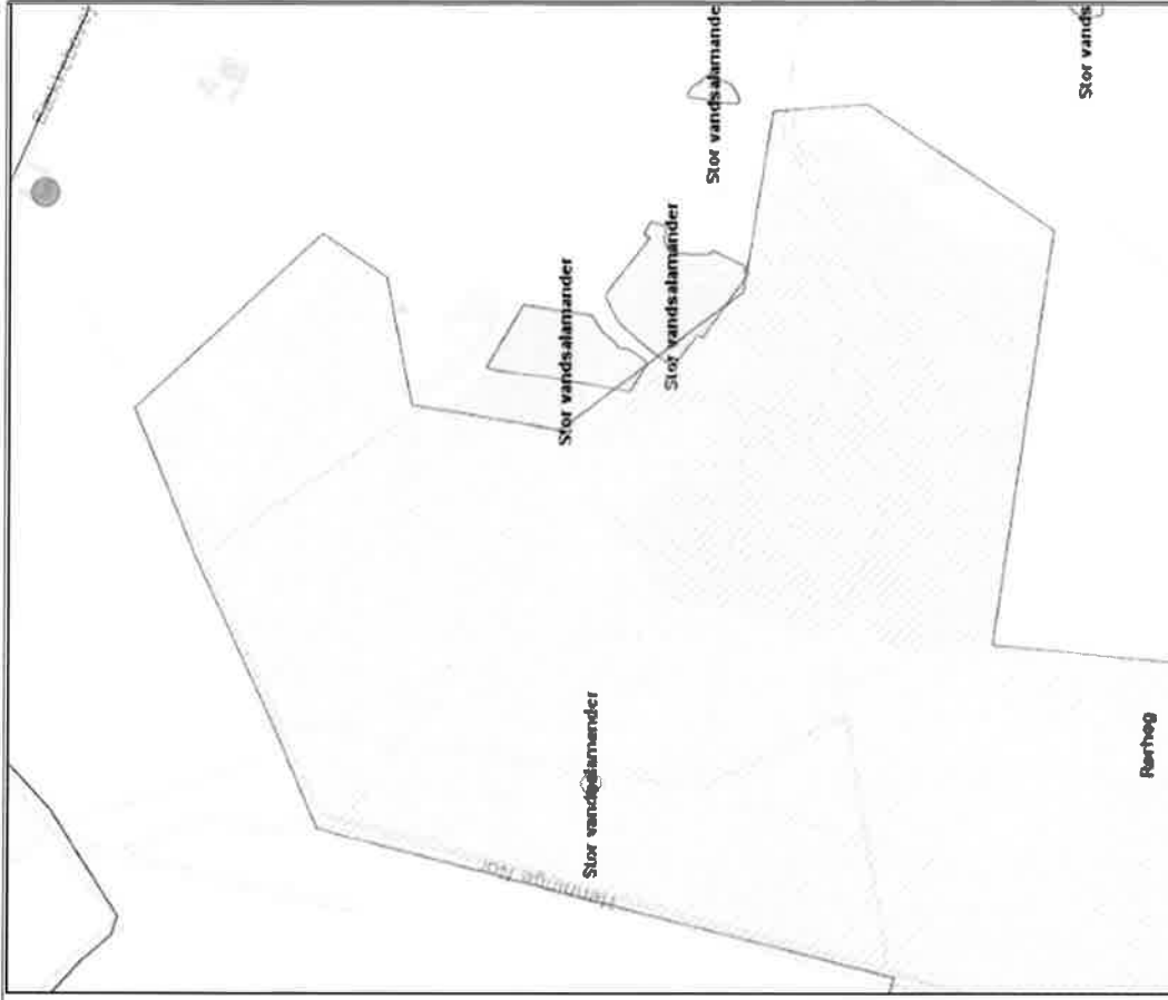
Figur 4 – Habitatnatur i nærheden af projektet. Strandeng og rigkær (orange skraver) og Elle- og askeskov (grå skraver).

På baggrund af afstanden og projektets karakter er det Svendborg Kommunes vurdering, at projektet hverken i sig selv eller i forbindelse