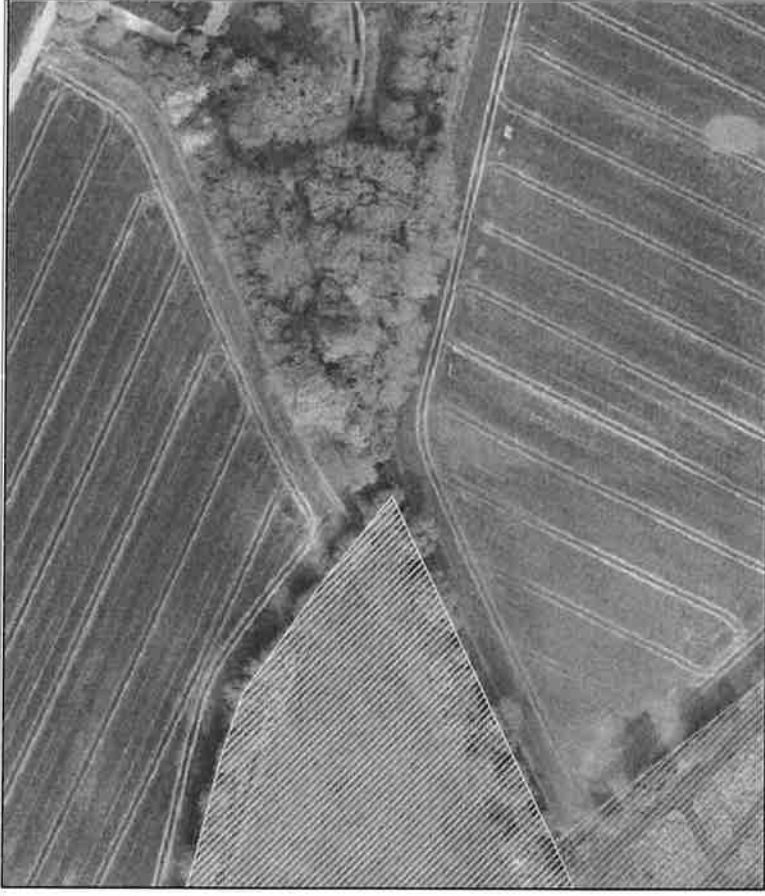
Figur 2 – Beskyttet eng (grøn skravering) og beskyttet strandeng (turkis skravering) i nærheden af projektet.

På grund af projektets karakter er det Svendborg Kommunes vurdering (jf. det forpligtende samarbejde), at det ansøgte projekt ikke vil ændre tilstanden af beskyttet natur i området. Vi vurderer desuden, at projektet vil være naturforbedrende for vandløbet og de å-nære arealer på den åbnede strækning.