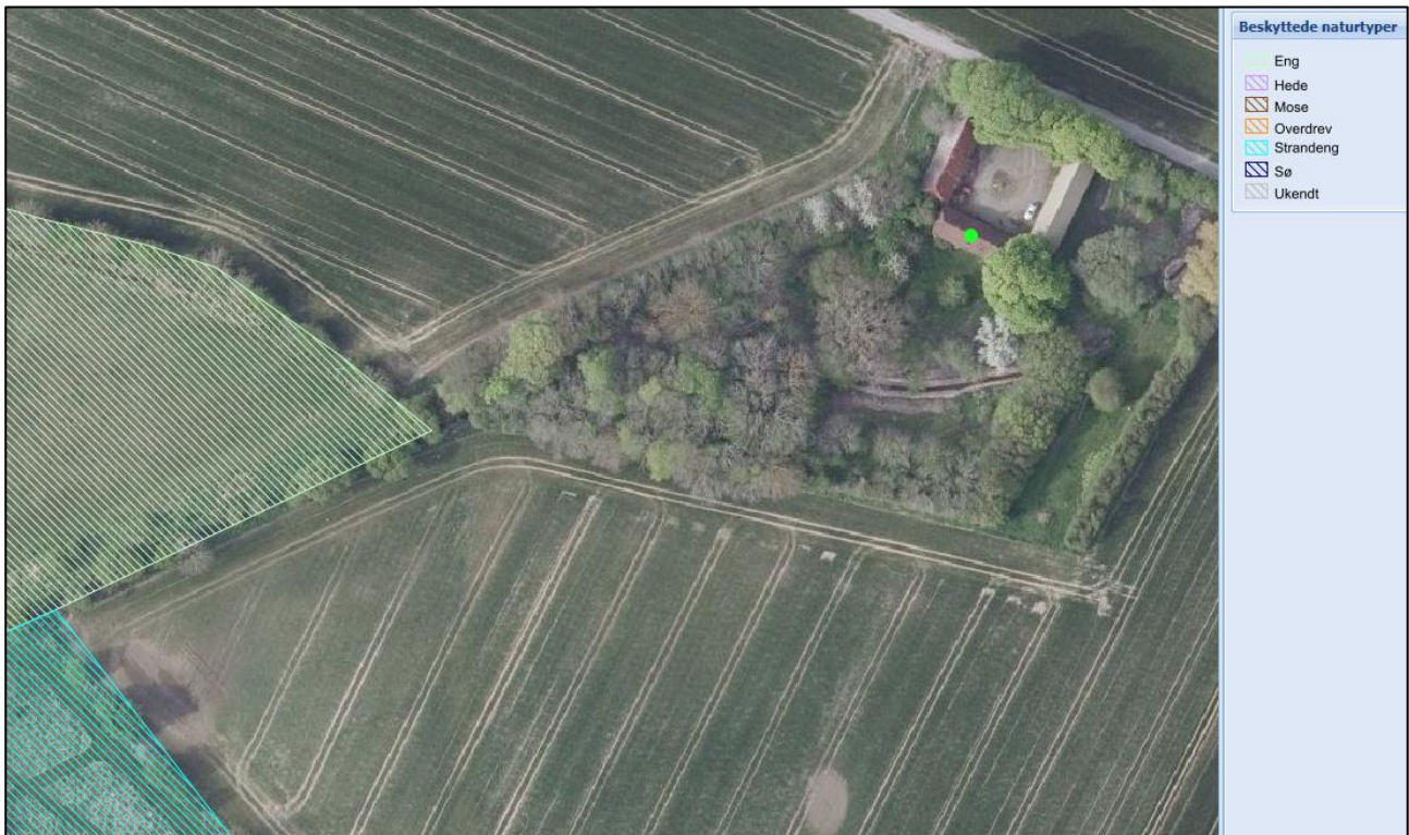
Figur 2 – Beskyttet eng (grøn skravering) og beskyttet strandeng (turkis skravering) i nærheden af projektet.

Der er ikke beskyttede naturområder på matriklen med det ansøgte projekt. Nærmeste beskyttede naturområde er en eng og en strandeng, som er beliggende umiddelbart vest for det ansøgte projekt. Se kort herunder: