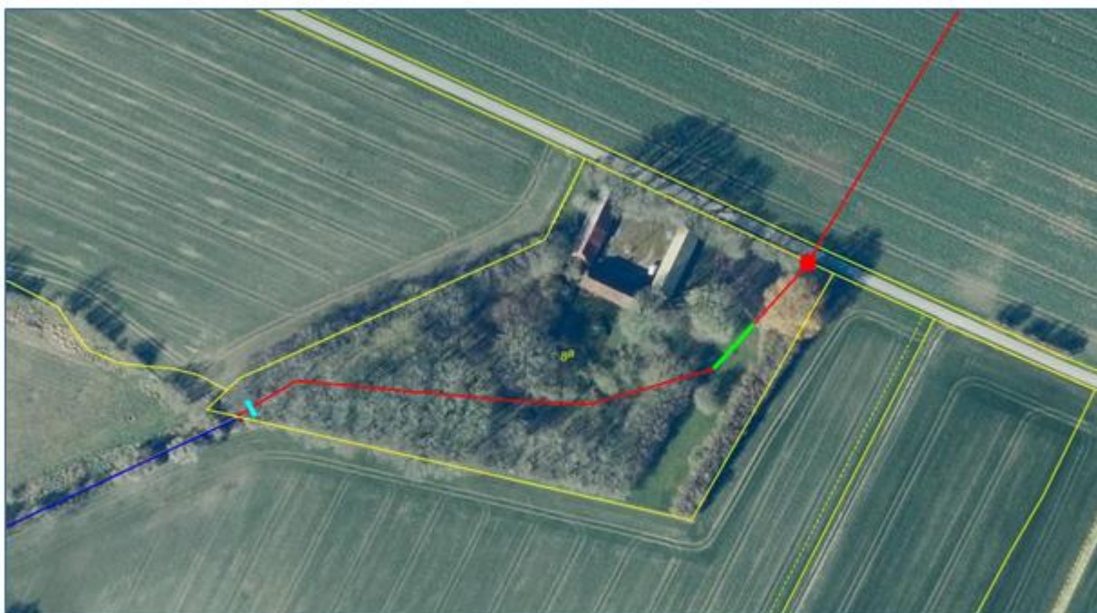
Figur 1 Oversigt over reguleringsprojekt. Rørledning (rød streg) åbnes fra brønd i skel (rød prik) til det Syd vestligste matrikelskel (gul streg) med undtagelse af 19 meter, der forbliver lukket (grøn streg) samt 1 meter gennem betonbygværket (turkis). Den åbne grøft syd for matriklen er markeret med blå.

Høring – reguleringstilladelse. Åbne den rørlagte strækning af det private vandløb, Henninge-afløbet, beliggende på matr.nr. 8a, Henninge By, Skrøbelev. Rørledningen optages og skråningsanlægget anlægges i 1:1. Det genåbnede vandløb vil således ligge i samme tracé og samme bundkote, svarende til rørledningens tracé og bundkote og således også følge det oprindelige tracé.