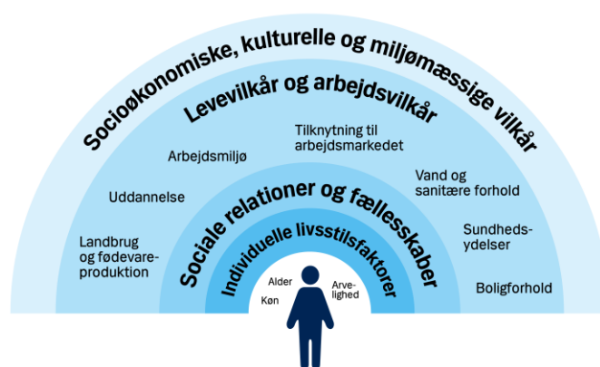
Figur 1: Med inspiration fra Dahlgren og Whitehead (1991) og Danske Regioner (2017)

Det er sammenfattet i nedenstående figur, der fint illustrerer, at det ikke er et sundhedsområde, der står alene med opgaven. Alle har et ansvar både borgeren selv, offentlige forvaltninger og civilsamfundet. Sundhed er noget vi er fælles om at værne om.