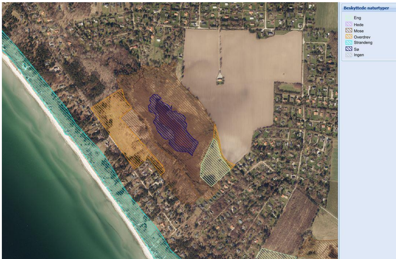
Kort 2. Beskyttede naturtyper i Piledybet.

I området yngler rørhøg og rørdrum, som er på udpegningsgrundlaget for fuglebeskyttelsesområdet. Området er i Natura 2000-planen udpeget som et potentielt levested for plettet rørvagtel, og projektet vil skabe bedre forhold for denne art samt en række andre vandfugle.