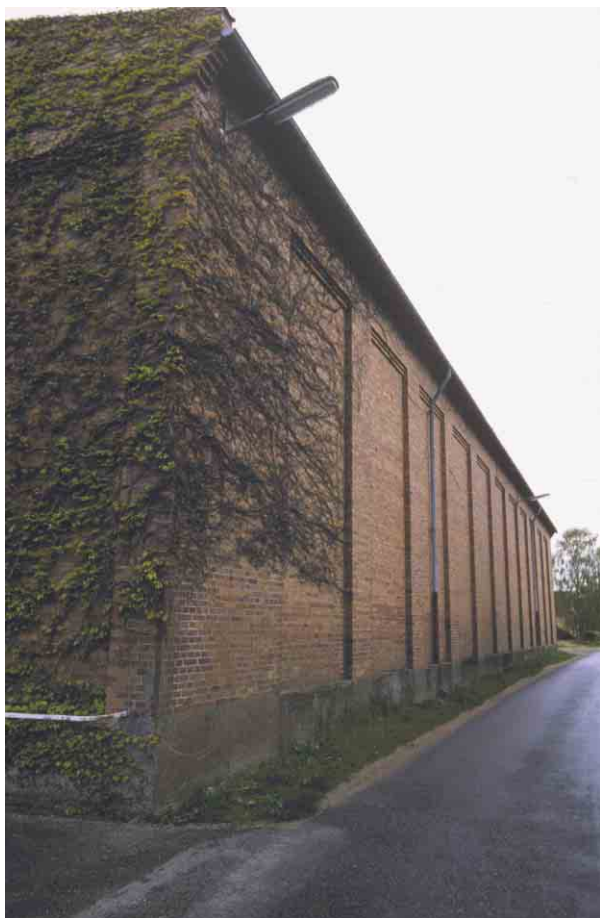
Lagerhallens østfacade med murede blændinger.

Kortlægning og registrering af kulturmiljøer