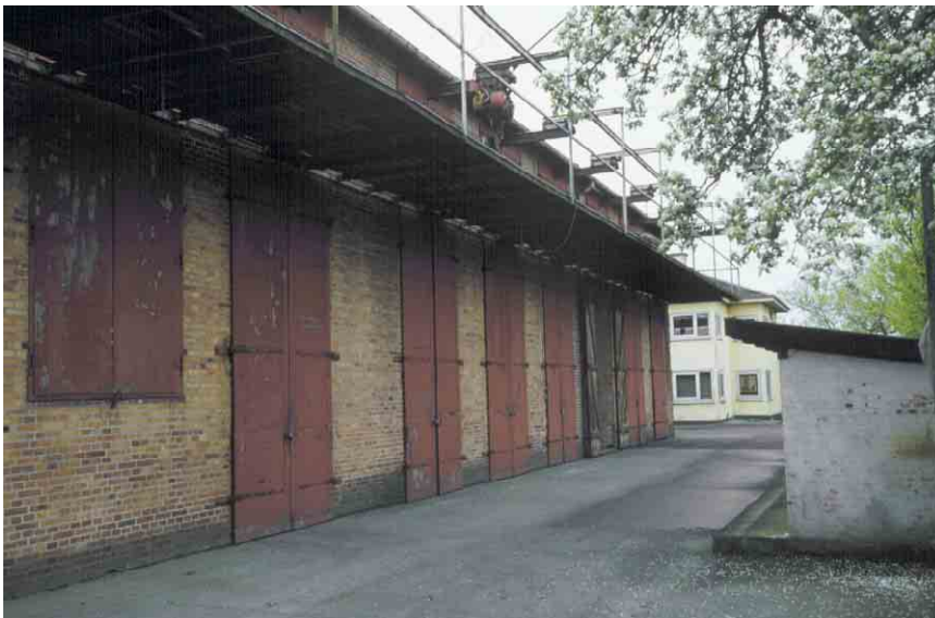
Lagerhallens vestfacade med svalegang og adgangsporte.