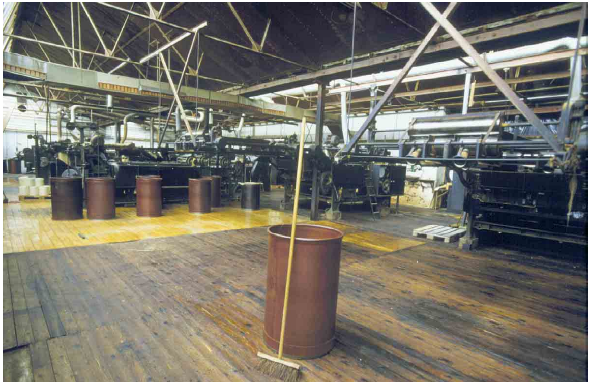
Gulvet er lige fejtet og maskinerne er klar til at køre igen imorgen.

Produktionen er idag ophørt. Men fabrikken står intakt med maskiner og generatorer.