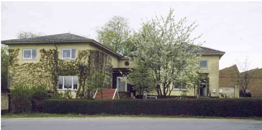
Direktørbolig og administrationsbygning er opført i funkisstilens karakteristiske "kassearkitektur".