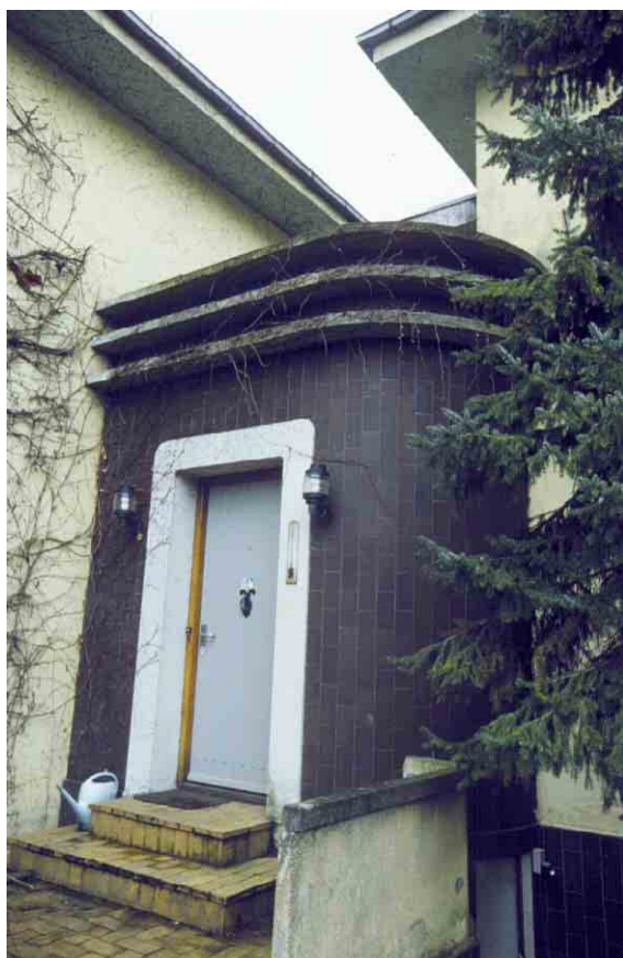
De runde maritime former og de markante gesimsbånd er typiske funkis og art-deco elementer.

Produktionshallen er opført med et stort shedtag, som med sine nordvendte vinduer forsyner hele gulvarealet med et fint, diffust ovenlys.