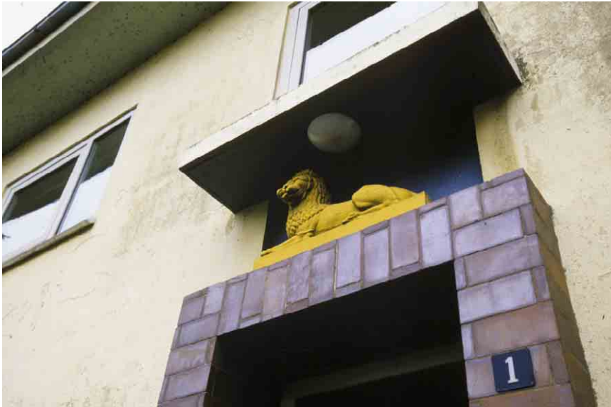
Detalje over indgangspartiet til direktørboligen.

Kortlægning og registrering af kulturmiljøer