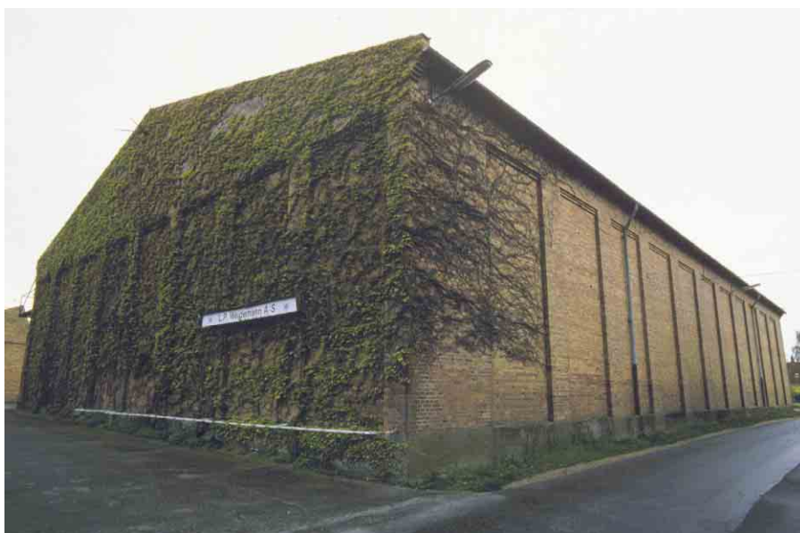
Lagerhallen er en god repræsentant for tidens nyklassicistiske fabriksbyggeri.