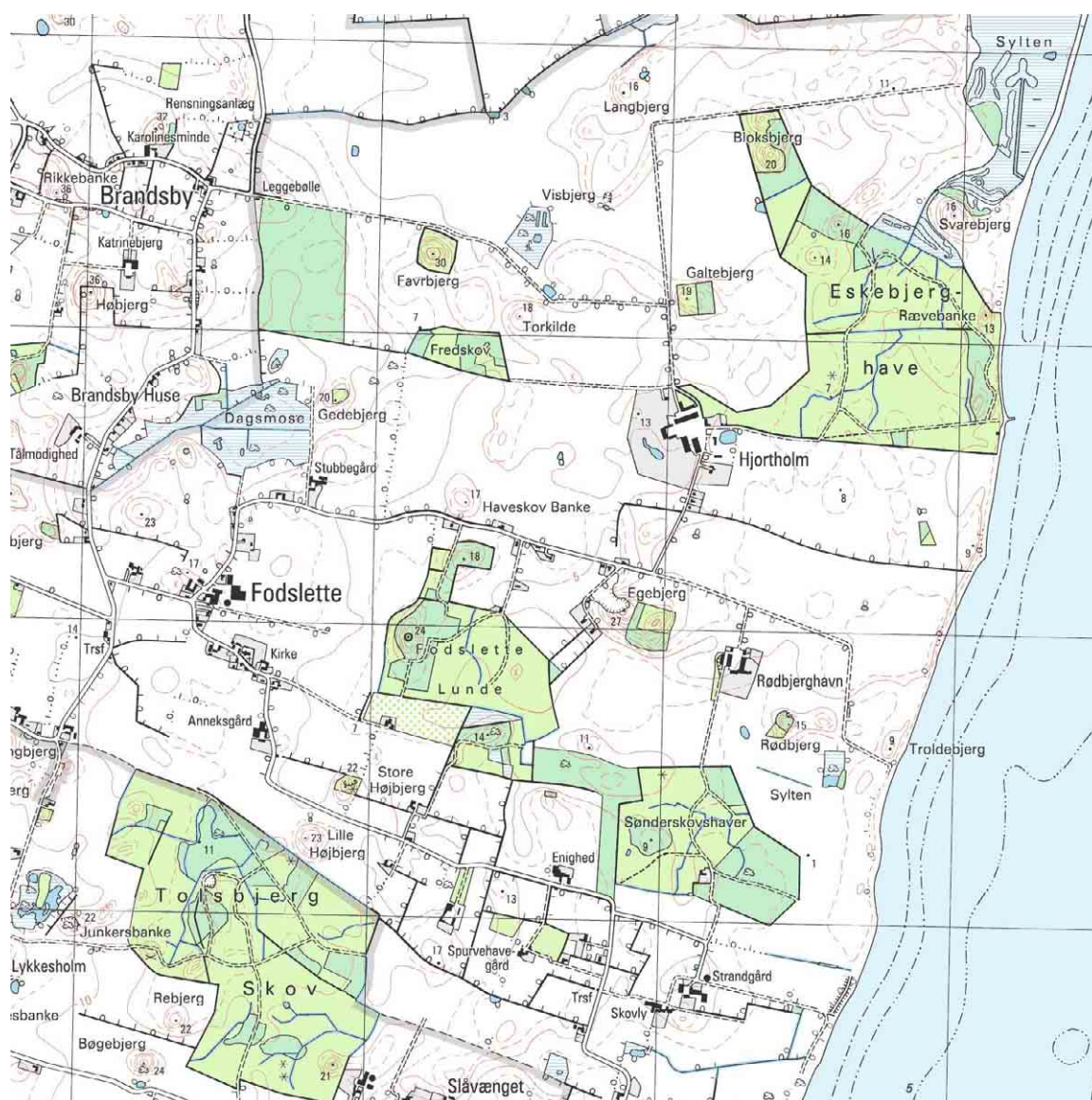
Kortudsnit i mål 1:25.000

Fodslette, Hjortholm og Rødbjerghavn i den sydøstlige del af Langeland ligger i et østfaldende område med jævn, leret bundmoræne med strøg af hatbakker, hvoraf Høgebjerg på 36 m er den højeste. Ved kysten findes skovpartier og vådområder vekslede med klinter og marint forland (udligningskyst).