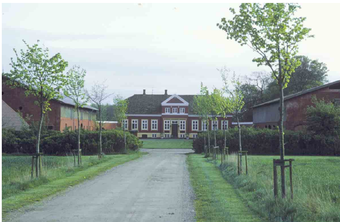
Rødbjerghavns trelængede anlæg er centreret aksefast omkring gårdens indkørsel.

Den trelængede gård er typisk for byggeskikken på Langeland i 1800-årene. Overalt på øen ses disse karakteristiske gårde med stuehus flankeret af stald- og ladelænger. Når gårdene tidligere ikke havde behov for større bygningsrum skyldes det, at det regnfattige klima tillod at en del af høsten kunne sættes i hæs i det fri. Mange af disse trelængede gårde er af høj kvalitet og danner med deres snævre gårdsrum et egenartet og intimt element i den lokale byggeskik. Rødbjerghavn tilhører denne gruppe, men hører til blandt de større.