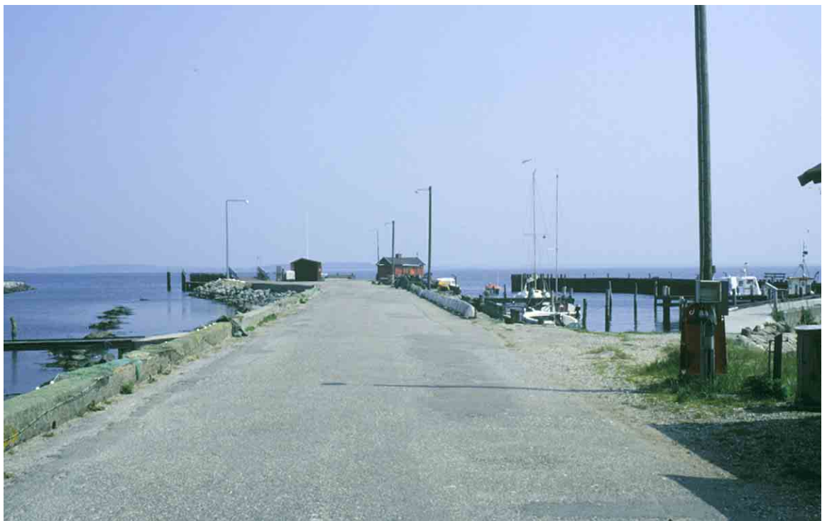
Strynø Brovej ender ude på spidsen af Grevebroen.

Dampfærgerne mellem Rudkøbing og Marstal kunne imidlertid ikke lægge til på grund af ringe vanddybde, så gods og passagerer måtte fragtes frem og tilbage på mindre både. År 1900 blev broen forlænget så færgen kunne anløbe. På Brohovedet opførtes et lille læ- og pakhuis som i en nyere version står på samme sted. På sydsiden findes stadig en rampe til brug for af- og pålæsning. Broen fik brolægning omkring 1925, og telefon og el i begyndelsen af 1930'erne. En både- og jollehavn på sydsiden anlagdes i 1920'erne. I 1954 indrettedes et egentlig færgeleje for at lette af- og indkørslen. Strynø fik egen bilfærge i 1966 da Sydfynske ophørte med besejlingen.