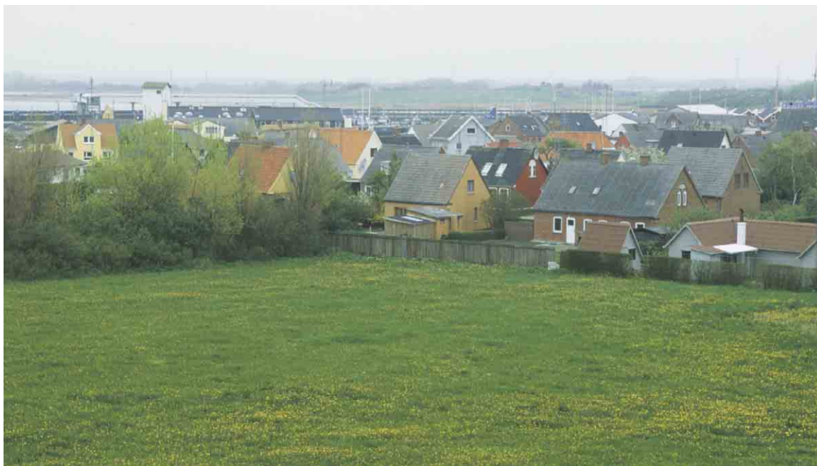
Udsigt fra Bagenkop Bjerg ned over den gamle bydel.

Kortlægning og registrering af kulturmiljøer