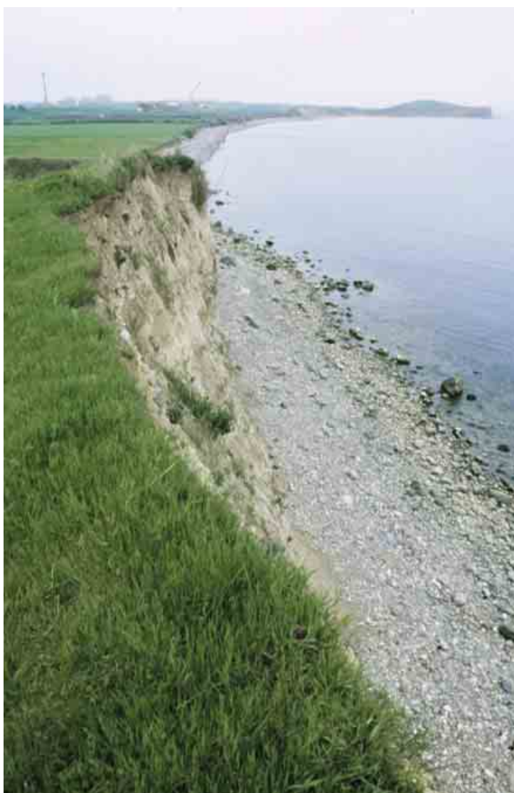
Bagenkop Bjerg, oprindeligt en hatbakke, er flækket tværs igennem af havet.