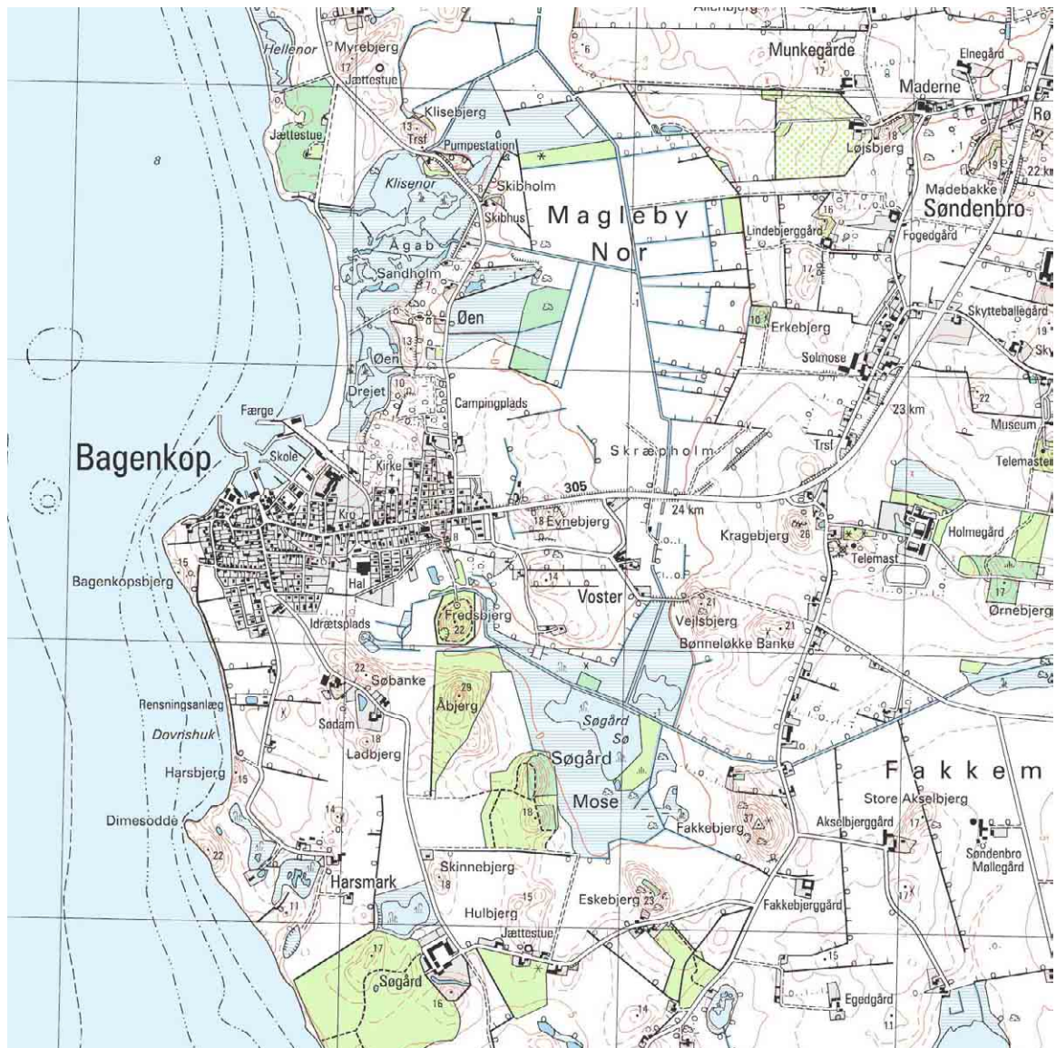
Bagenkop, kortudsnit i mål 1:25.000

Bagenkop er anlagt i 1500-årene som et lille fiskerleje på en landtange ved Magleby Nors sydlige udmundning. Bagenkops fiskere udnyttede oprindeligt noret til fiskeri og havn. Med tørlægningen af Magleby Nor i 1850'erne forsvandt fjordfiskeriet. Til gengæld blev byen sat i bedre forbindelse med det øvrige Langeland via vejdæmningen over noret, og da den økonomiske vækst samtidig begyndte at gøre sig gældende kunne byen udvikle sit kyst- og havfiskeri.