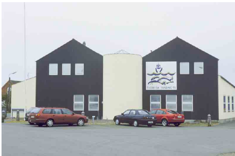
Thorfisk trading's bygninger på havnen.