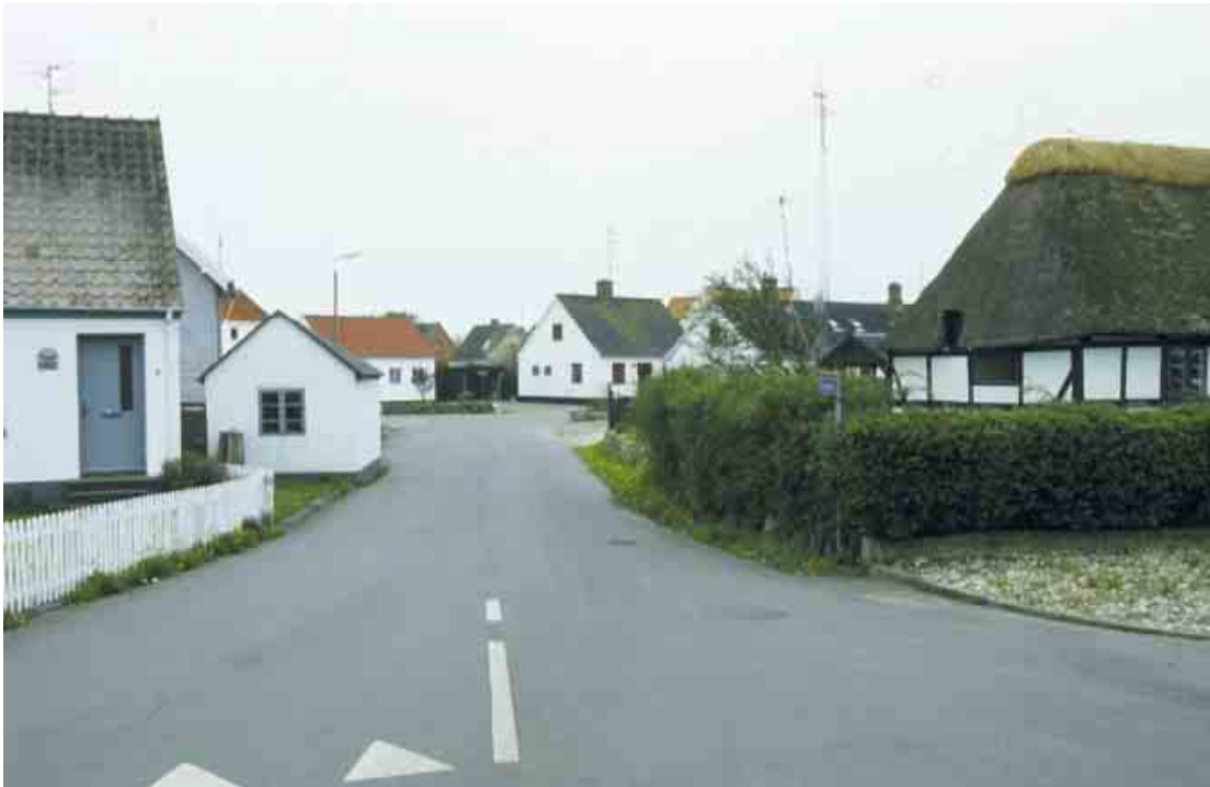
Strandgade knytter havnen og den gamle bydel sammen.