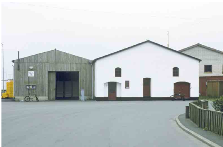
Bagenkop Havns gamle ishus står med sit massive murværk solidt på terrænet.