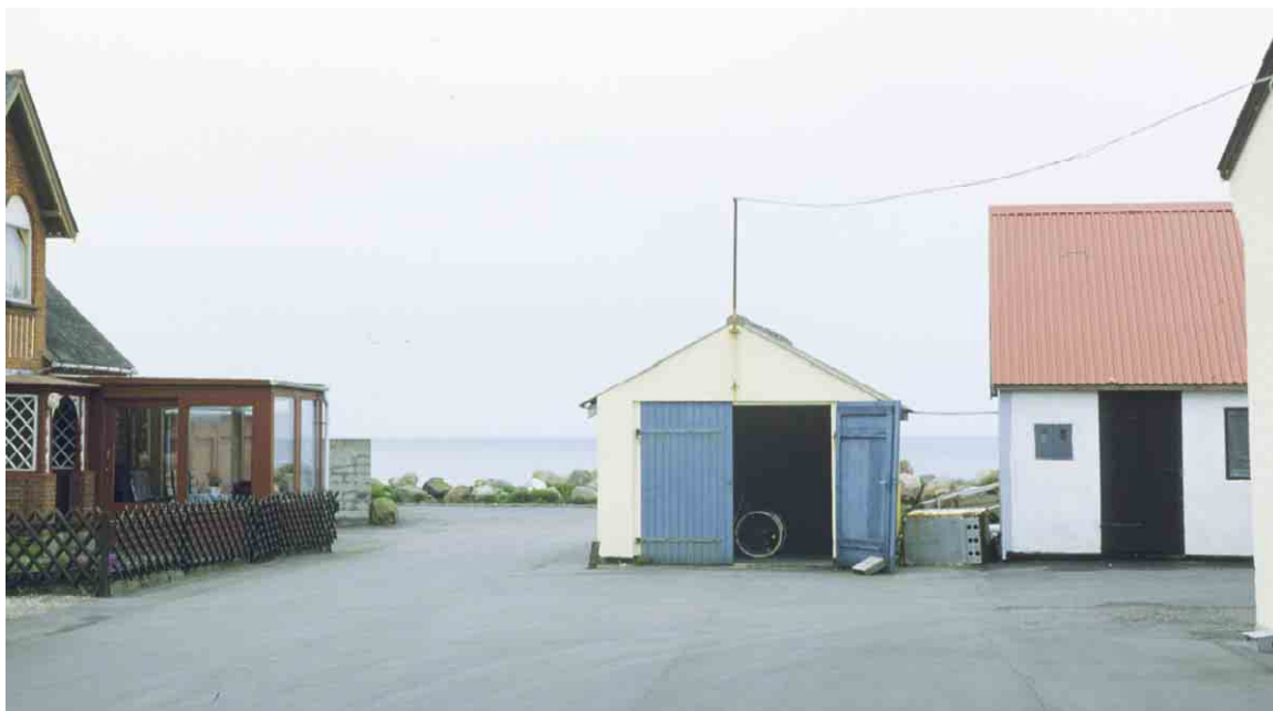
Byen og havet mødes flere steder fuldkommen uformidlet.