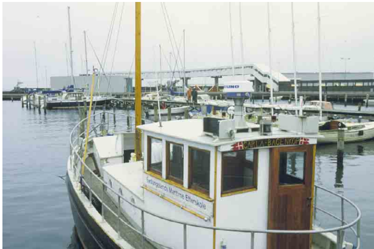
Bagenkop færgeleje venter med sin passagersluse på genoptagelsen af færgefarten.

Kortlægning og registrering af kulturmiljøer