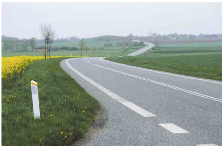
Den omlagte landevej sigter frem mod spiret på Bagenkop Kirke.

Kortlægning og registrering af kulturmiljøer