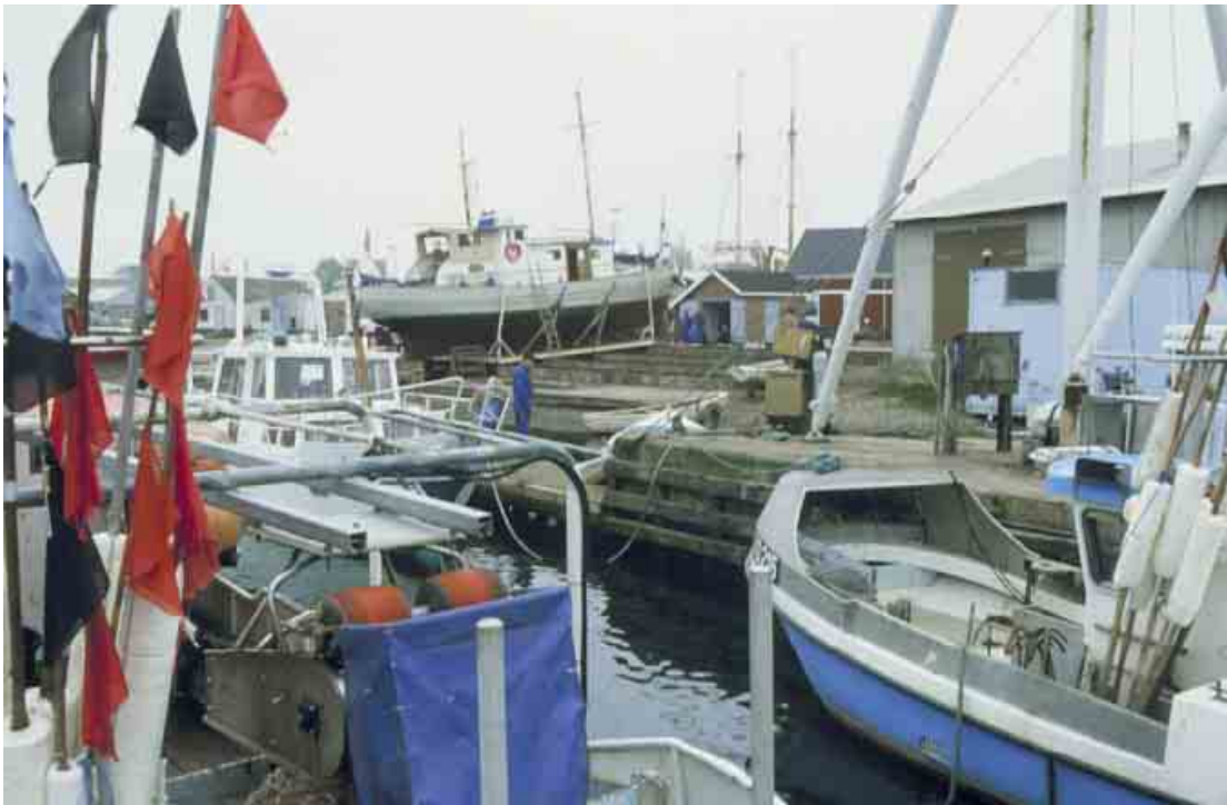
Bagenkop Havn med fiskerflåde og ophalerplads.

Kortlægning og registrering af kulturmiljøer