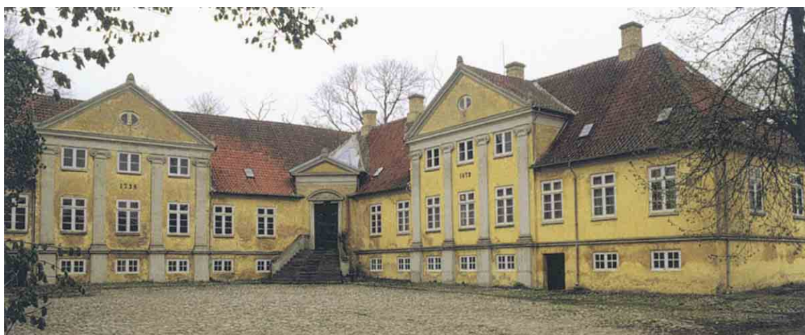
Broløkkens fintpudsede hovedhus fra 1758 fik godt 100 år senere sin kloning. En nøjagtig kopi af det oprindelige hus opførtes vinkelret på det gamle.

I Magleby er der en spændende bygningsmæssig sammenhæng - tilsigtet eller utilsigtet - mellem herregården Broløkke, det gule gårdanlæg med det nye sortmalede anneks, som husede kunsthøjskolen og kirken på bakkens top. Andre bygninger der påkalder sig opmærksomhed er Søndebro mejeri og Søndebro station, der begge er særdeles gode repræsentanter for de respektive funktioner. Mejeriet er bygningsfredet.