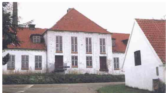
Søndebro Mejeri udgør et kompleks af bygninger, hvor hovedhusets fremspringende midterparti dominerer anlægget.