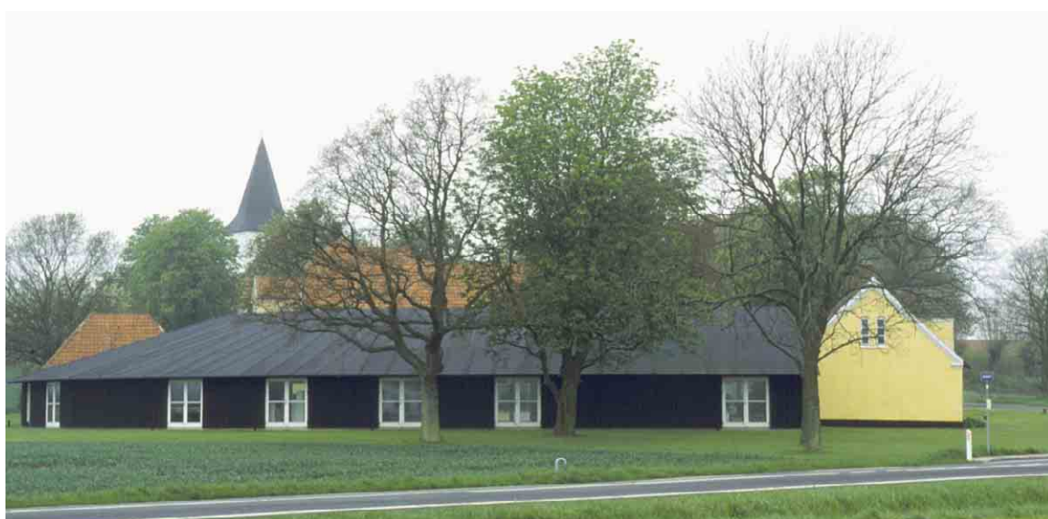
Udsigt fra landevejen mod den tidligere kunsthøjskole og Magleby kirke.