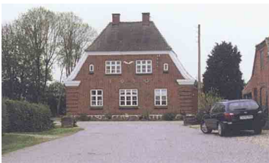
Søndebro Station er som mange af Langelandsbanens stationer placeret for enden af en snorlige stikvej.

I 1806 skrev professor Begtrup at sognets bebyggelse bestod af én stor by der strakte sig 1/2 mil i længden. Den kæmpemæssige slyngede vejby var løst opbygget og sammensattes i 1662 af flere bydele, Nordenbro, Bøsseballe, Magleby Kirkeby, Brobjerg, Vråstrup og Søndebro. Magleby Kirkeby omtales 1231 som Makleby, dvs. den store by og hentyder formentlig til hele bebyggelsen.