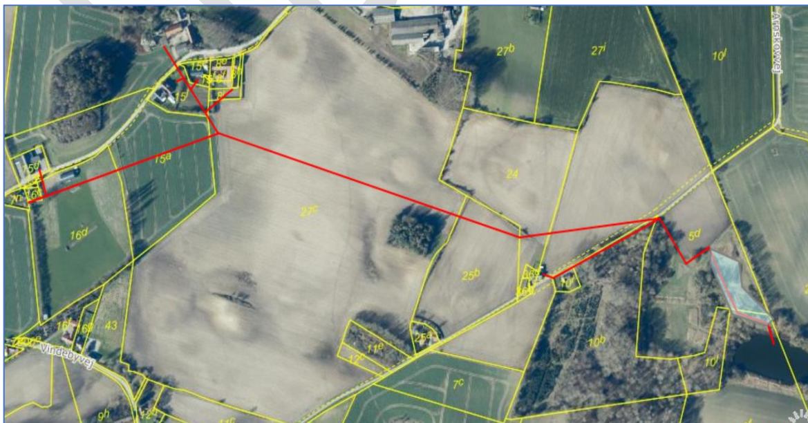
Figur 1: Omtrentlig placering af rørledning (rød linje) med tilhørende bassiner (område med bassiner angivet med lyseblå). De gule linjer angiver matrikelskel.

Rørledningen med tilhørende bassiner som afvander til Arnskovmosen optages som fællesprivat spildevandsanlæg. Ejendommens tag- og overfladevand afledes som hidtil.