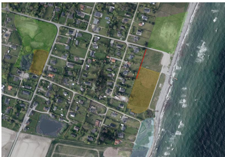
Beskyttet natur på arealet, rød linje viser digets forløb.

Svendborg Kommune har vurderet at der kan meddeles dispensation til det ansøgte, gerne med vilkår om at hele arealet fremover plejes med slåning og opsamling af materialet. Samt at den nordlige del af arealet, som ikke er § 3, fremover behandles med de samme driftshensyn som hvis det var beskyttet natur. Idet Langeland Kommune har truffet beslutning om at alle kommunens arealer udelukkende kan anvendes til afgræsning eller slæt, samt at der ikke må gødes eller anvendes pesticider på arealerne, er dette helt i tråd med plejeplan for området. Svendborg Kommunes anbefalinger vil blive indført i plejeplanen for området.