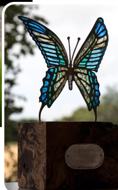
Langelands kulturliv - før og nu