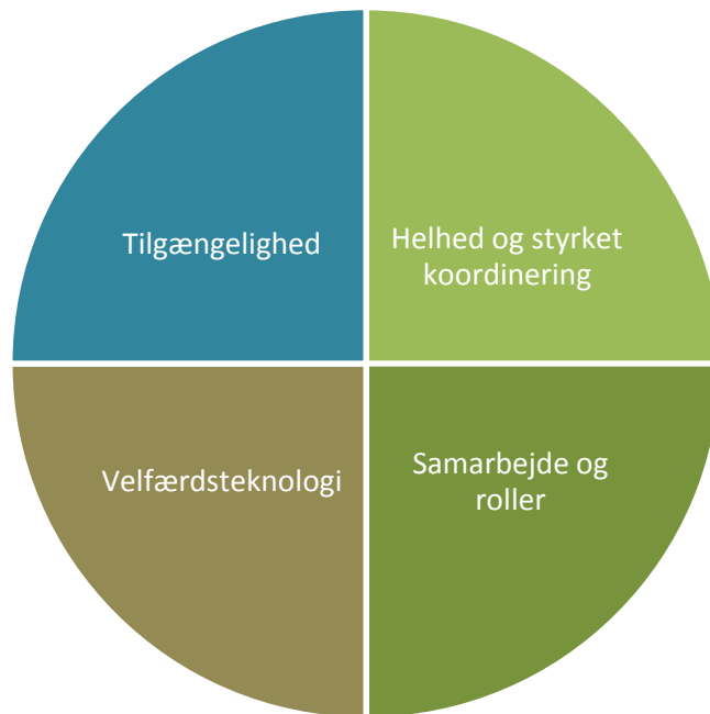
Prioriterede indsatsområder for Handicappolitik 2017-2021

Indsatsområderne i Handicappolitik 2017-2021 tager udgangspunkt i de beskrevne værdier og principper. Der er fem prioriterede indsatsområder, som giver et billede af de områder som Langeland kommune vil have særligt fokus på i opgaveløsningen i de kommende år.