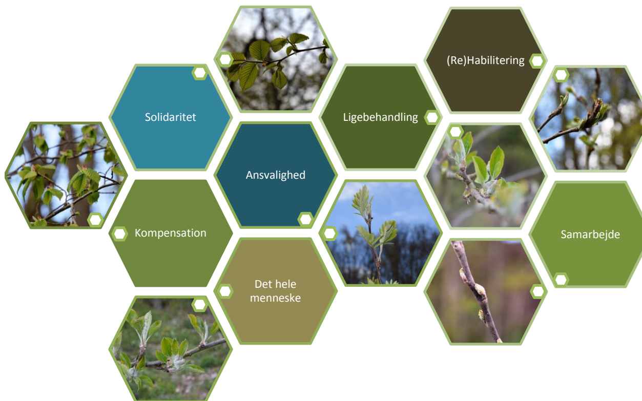
Principper og værdier i Handicappolitik 2017-2021

Løsningerne skal dermed tage afsæt i et konkret individuelt skøn, for at sikre det enkelte menneskes unikke kvaliteter.