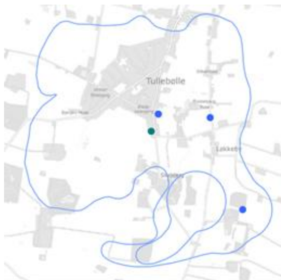
Fig. 1: Indvindingsopland til Tullebølle Vandværk

Langeland Kommune har modtaget en ansøgning om VVM-screening fra Tullebølle Vandværk, vedrørende ny indvindingstilladelse. Indhold i tilladelsen vedrører en reduktion af indvindingsmængde fra 50.000 m 3 til 35.000 m 3 . Indvindingsoplandet er angivet med blå på fig.1.