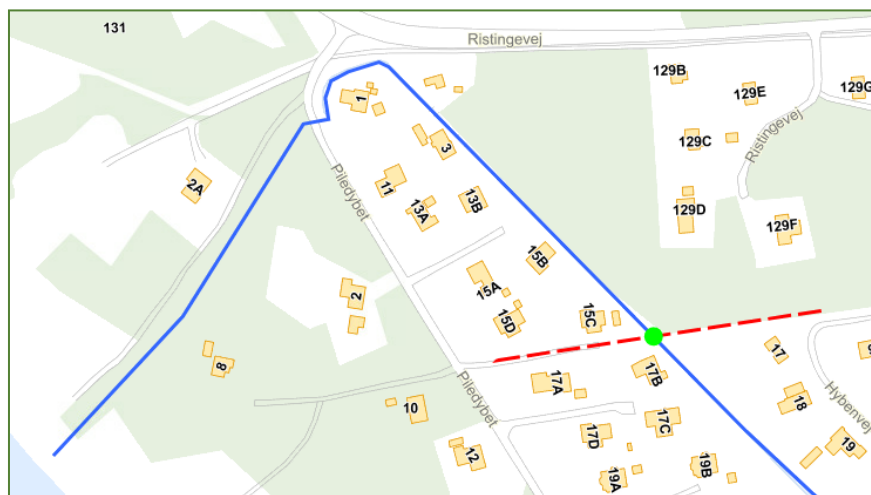
Figur 1. Krydsning (grøn) med elkabel (rød) af afløbet fra Piledybet (blå).

Projektet vedrører en sænkning af et eksisterende kabel, der krydser et privat udløb i Piledybet. Krydsning vedrører matr. 45kæ, 45bf, samt 45ks alle Hesselbjerg By, Humble, Mellem Piledybet 15C og Ristingevej 129 b-h.