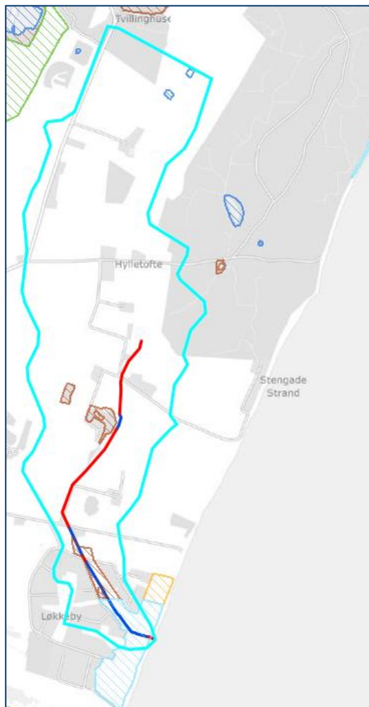
Figur 1. Maglemoseløbets placering og opland (turkis), hvor den åbne del af vandløbet er markeret med blå og den rørlagte med rød. Beskyttet natur er angivet med skraveret.

Maglemoseløbet omfatter en samlet strækning på 1597 m, hvoraf de 700 m består af en åben rende mens de 897 m er rørlagt.