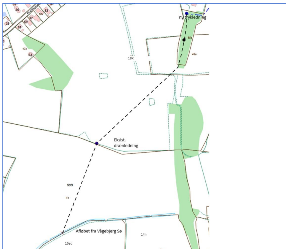
Figur 1. Eksisterende drænledning

Ledningen løber fra banelinjen Matrikel 66 og 68a, Humble By, Humble over matrikel 18x og 1c Humble By, Humble med udløb i den åbne rende som vist på figur 1.