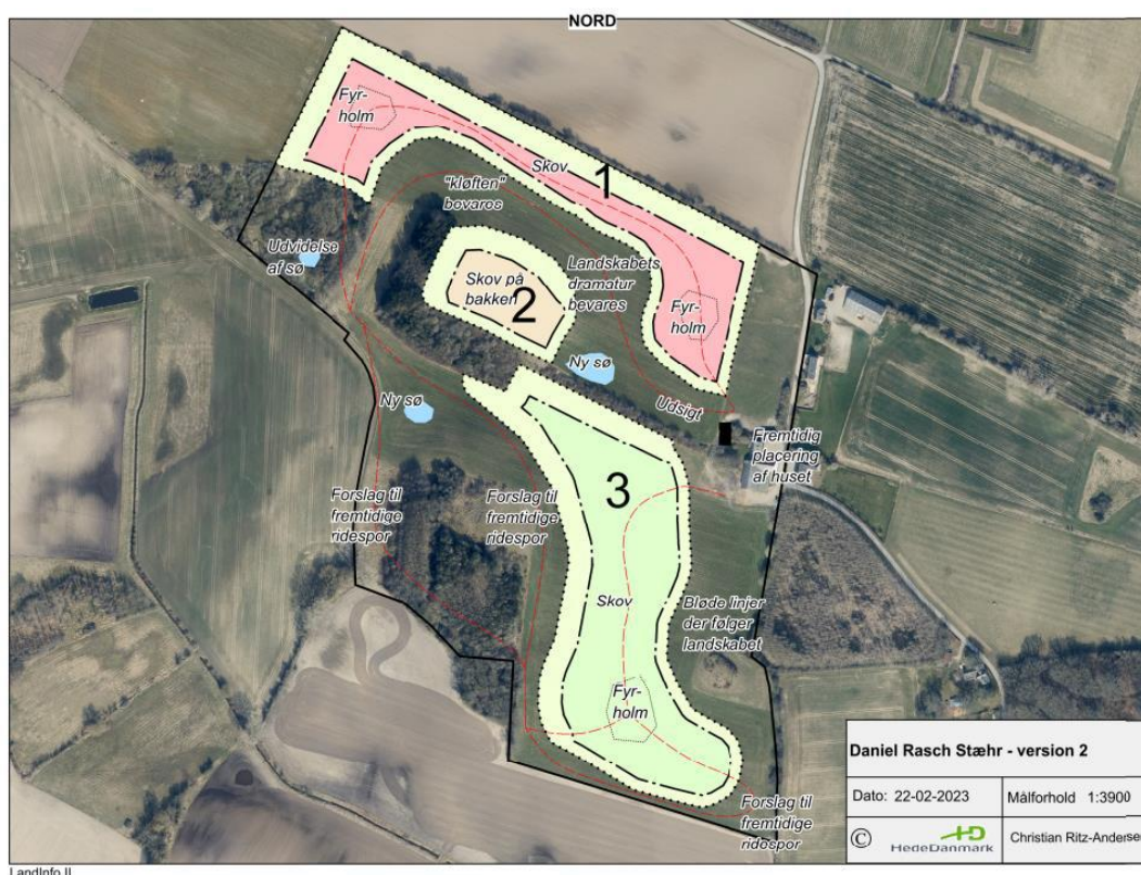
Figur 1 ønsket placering af de 3 vandhuller.

Indsatte kortbilag (fra ansøgning) viser søernes placering.