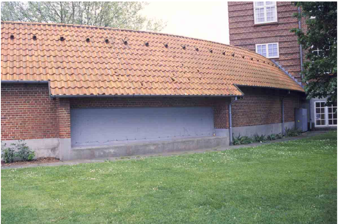
Den krumme mellebygning forbinder på en ubesværet måde den ældre og nyere del af skolen.