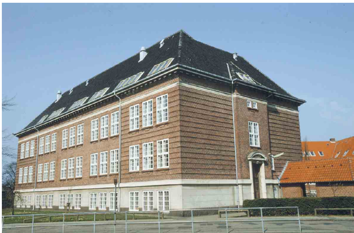
Den gamle tunge skolebygning er typisk for sin tid.

Senere er opført yderligere en række bygninger bl.a. den store etplansbygning øst for de oprindelige skolebygninger. Der er her tale om en noget tarveligere standard end det foregående byggeri.