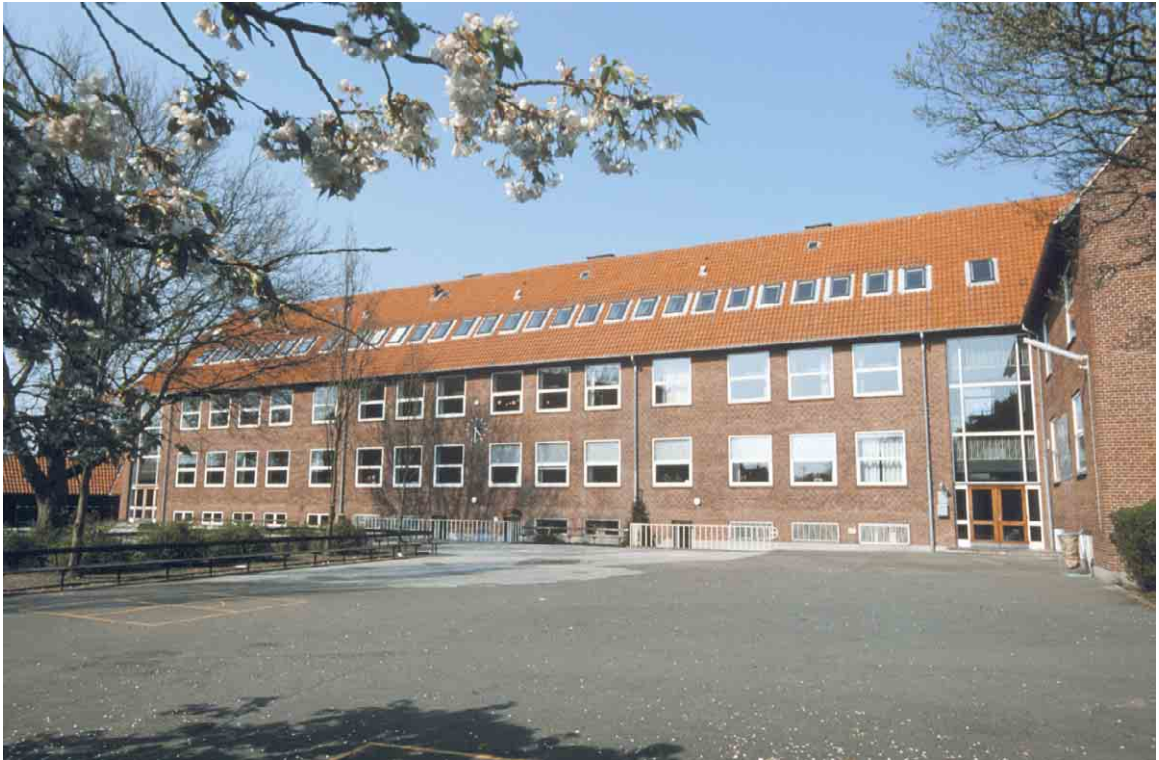
Den nye bygning fra 1957 varsler med sin ligefremme arkitektur om efterkrigstidens friere pædagogik.

Kortlægning og registrering af kulturmiljøer