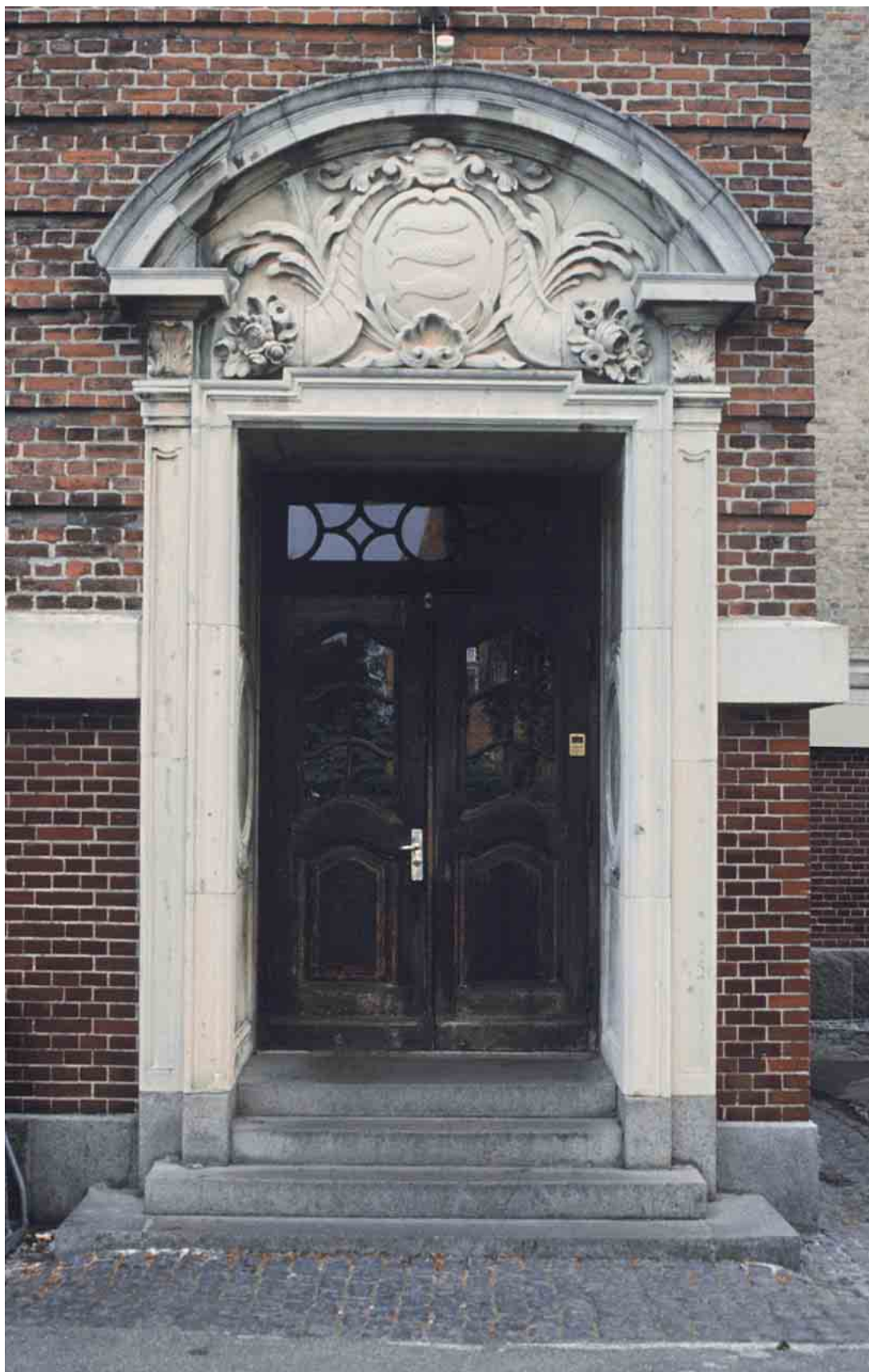
Indgangspartierne til den ældre skolebygning er overdådigt udsmykket.

Kortlægning og registrering af kulturmiljøer