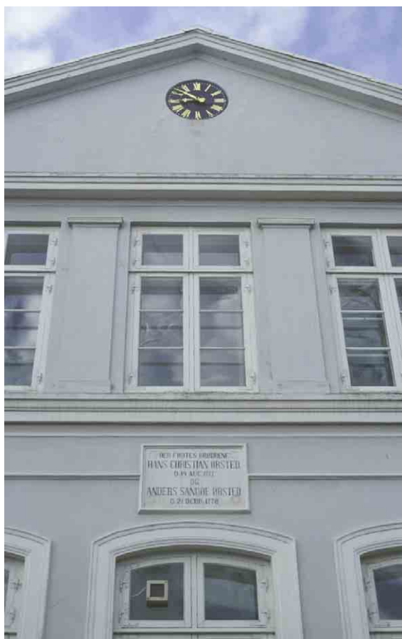
Brogade 15's gavlkvist i gade- facaden. Uret stammer fra en bygning i Tivoli i København.