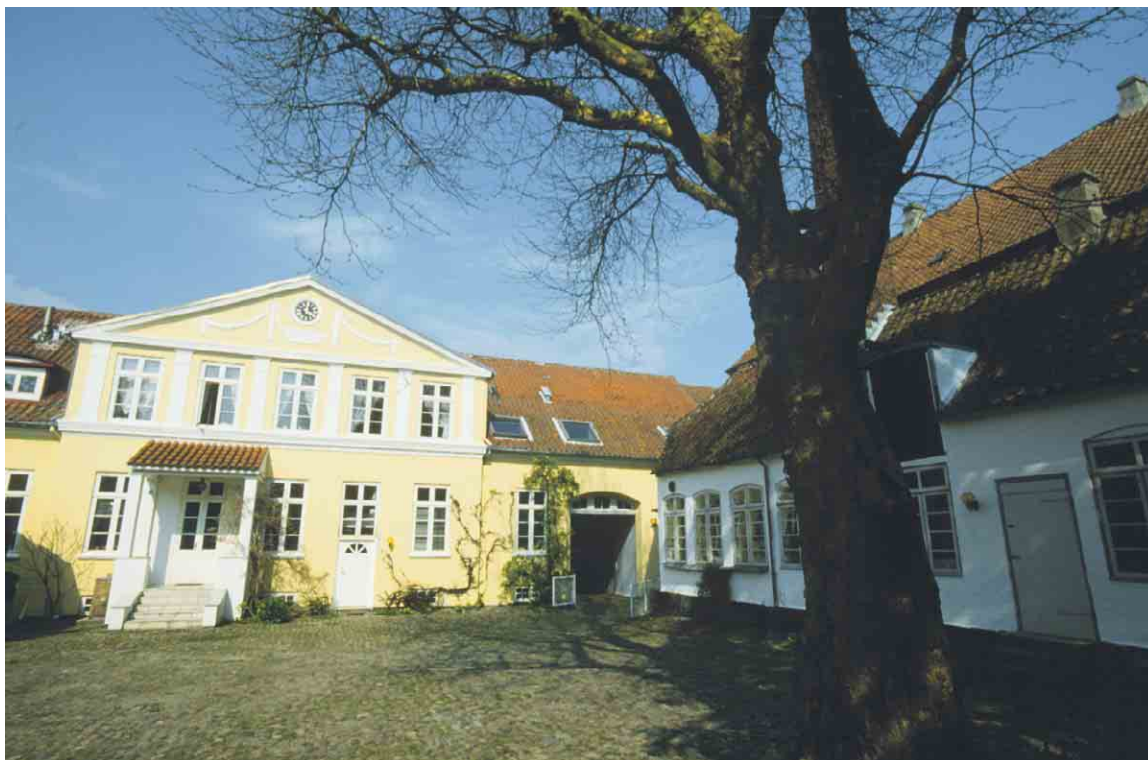
Hovedhusets facade mod gården stor i gul puds. Sidebygningen til højre rummer det lille museum.

Kortlægning og registrering af kulturmiljøer