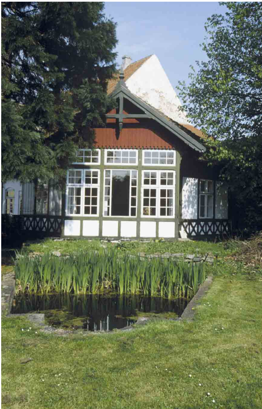
Den fine havepavillon står med sine opsprossede vinduesfag og spejler sig i den foranliggende lille dam.

Kortlægning og registrering af kulturmiljøer