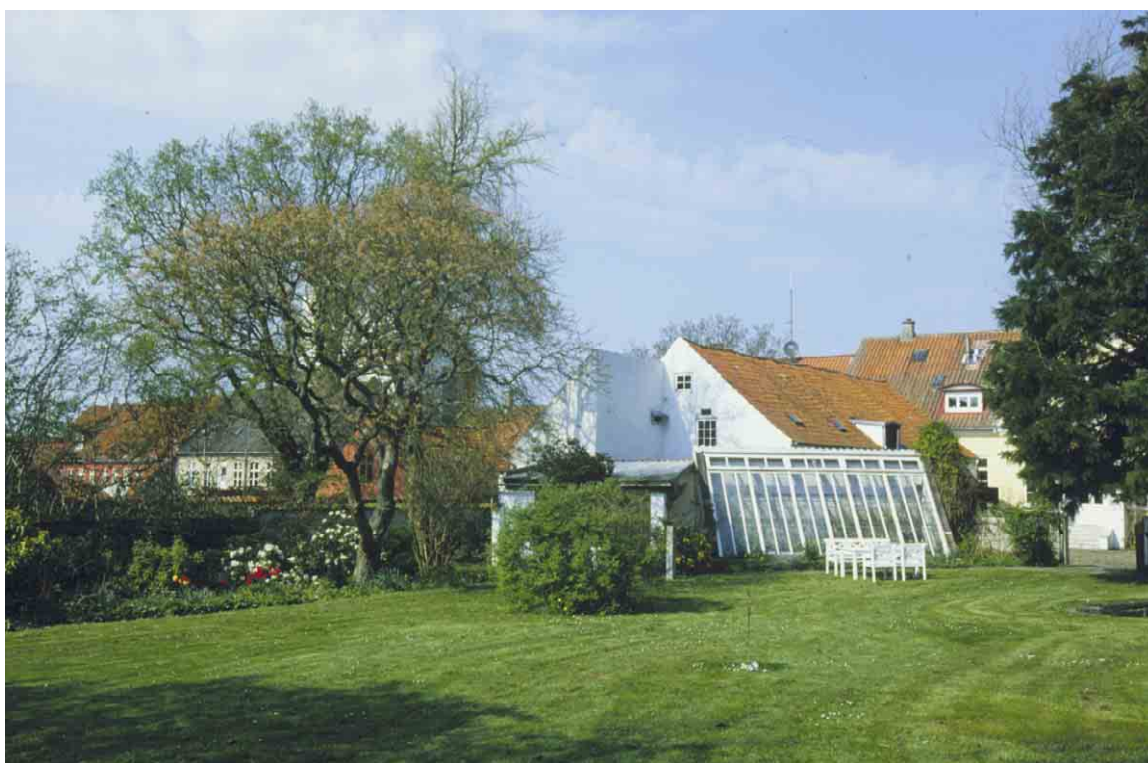
Apotekets gård fortsætter mod syd ud i en stor have med drivhus og pavillon. Haven er ligesom bygningerne fredet.