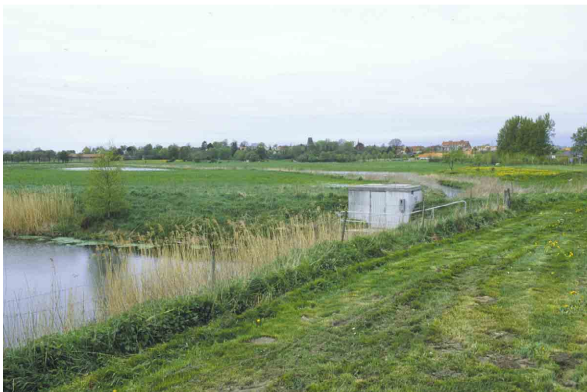
Udsigt ind over Vejlen - set fra sydvest.

Lavbundsområdet danner et godt 1/2 km bred og ca. 2 km dybt, vinkelbøjet indløb, omgivet i nord af Rudkøbings bygrund, i syd af lavere områder ved Kragholm. Den afbrydes i øst af en lav landbro, som adskiller den fra lavningerne ved Lindelse Nor.