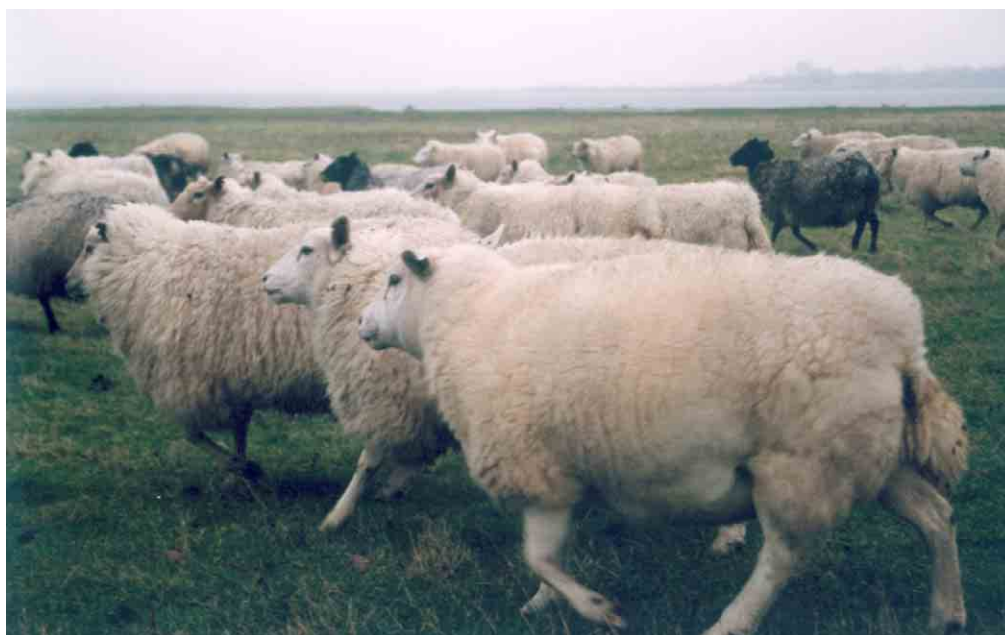
I dag er der stort fårehold på Strynø Kalv.

En gård på denne lille ø i havet. Her var middelalderbondens frontlinie trukket op. Efter midten af 1600-årene var gården delt i tre. Formentlig var det også her brugen af tanggødning som åbnede for nyttiggørelsen af mere arbejde gennem er højere ydende landbrug. Både Strynø og Strynø Kalv var inddigede, men de viste sig utilstrækkelige ved den store stormflod i 1872 og blev derefter forstærkede og udbyggede. I 1921 boede 26 mennesker på øen. Gårdene var beboede og i drift til ind i 1970'erne, men anvendes nu til fritidshuse. Jorden er udlagt til fårehold.