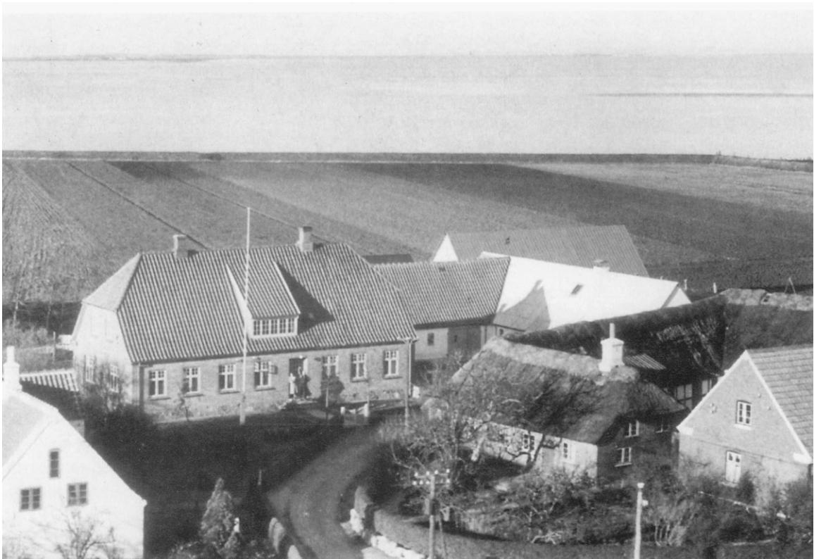
Strynø Kalvs bebyggelse, bestående af tre gårde, klumper sig sammen på midten af øen. Foto fra ca. 1955.

Bebyggelsen består af 3 gårde, som er infiltret i hinanden, så det er vanskeligt at skelne, hvor den ene begynder og hvor den anden slutter.