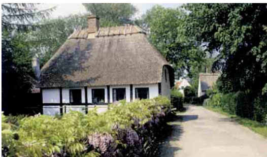
Op ad Kirkevej hænger blåregnens graciøse blomsterklaser ud over vejskellet.

I 1803 fandtes øens eneste træer i præstegårdens have. Byen har fået sit tætte vegetationsdække inden for de sidste 50 år, så selv om byhusene er bevaret, kan det være vanskeligt at fornemme det oprindelige åbne byrum.