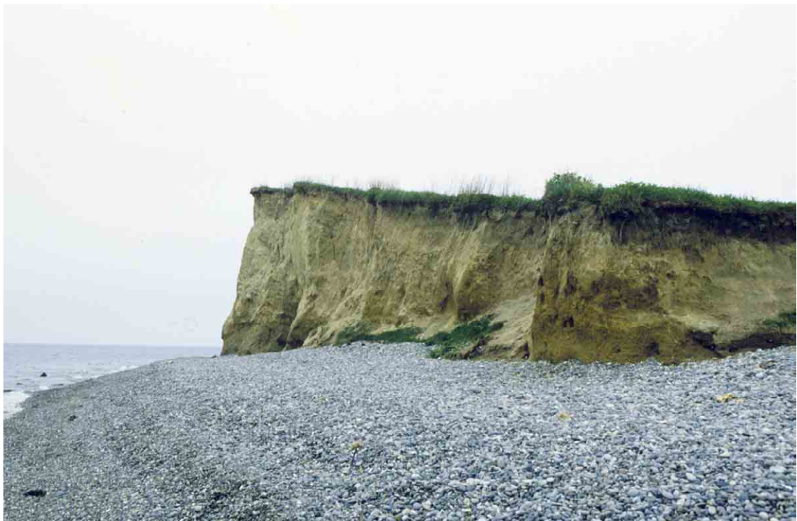
Dovns Klint står med sin bratte afslutning som en skibsstævn ud mod havet.

Ved Dovns Klint på Langelands sydspids findes de to stævningsskove, Østre Gulstav ved selve klinten og Vestre Gulstav ved Gulstav Klint, adskilt fra hinanden af et lavt engdrag.