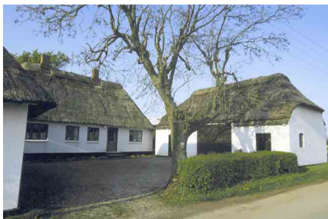
Østerskovvej 49 viser endnu et eksempel på den lille 3-længede gård. Her er fjerdesiden markeret af en lav hæk og et stort træ.

Endelig bør Tryggelev Varmeværks nye bygningsanlæg fremhæves for sin fint indpassede arkitektur på trods af de meget store og industrielt robuste bygningsvolumener. En medvirkende årsag til den vellykkede placering er bygningernes sorte bemaling, der får de store "kasser" til at synes mindre påtrængende.