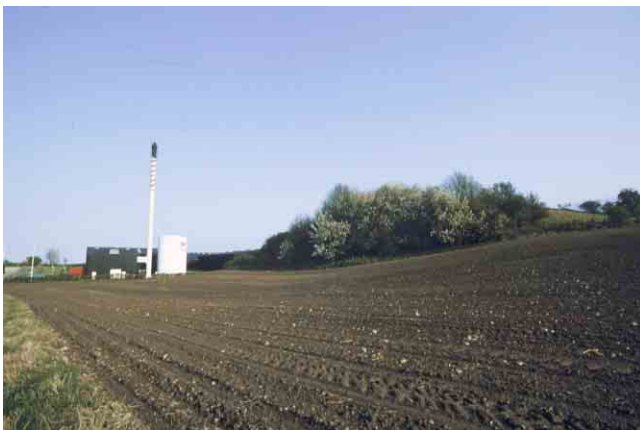
Tryggelev Varmeværk er på trods af sine store bygningsvolumener fint indpasset i landskabet.