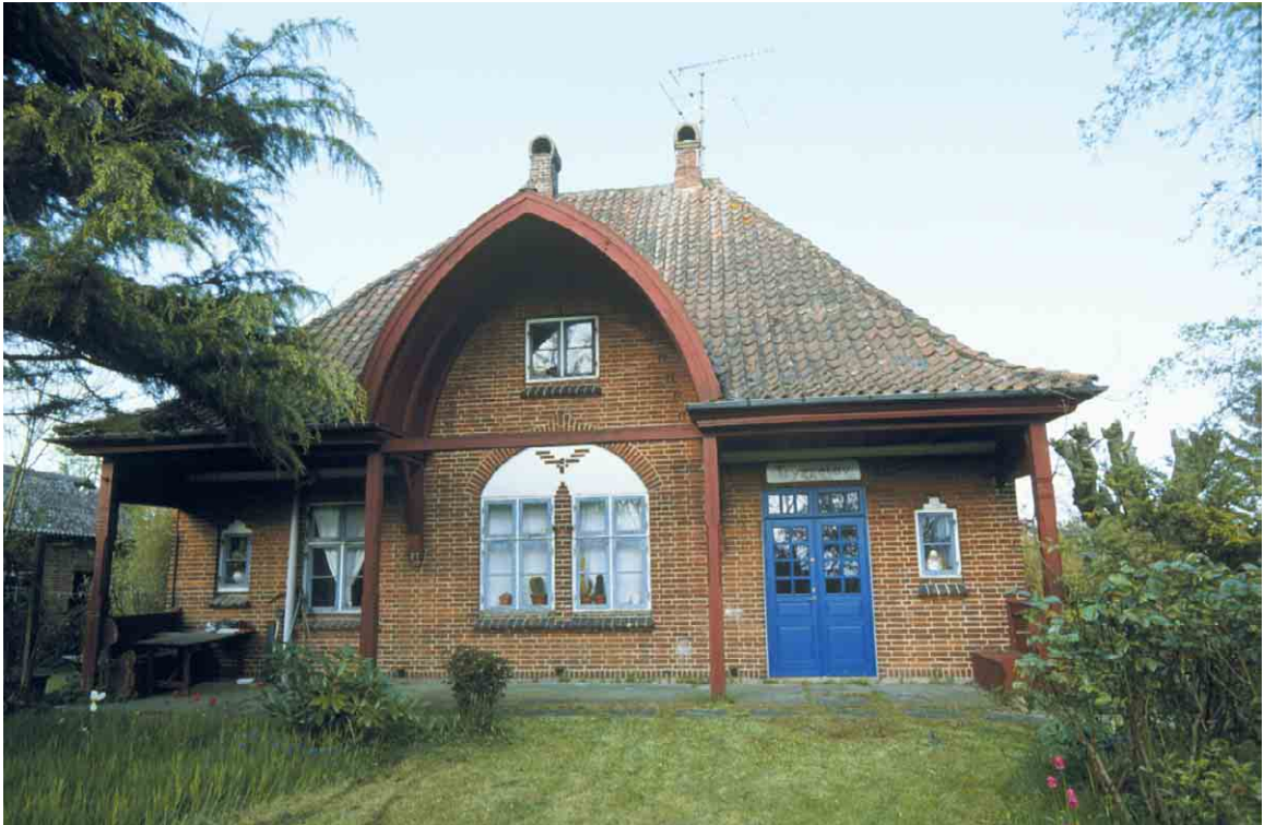
Tryggelev station har en meget flot overdækket perron, båret af træsøjler og afsluttet med en spidsbue i taget.

Kortlægning og registrering af kulturmiljøer