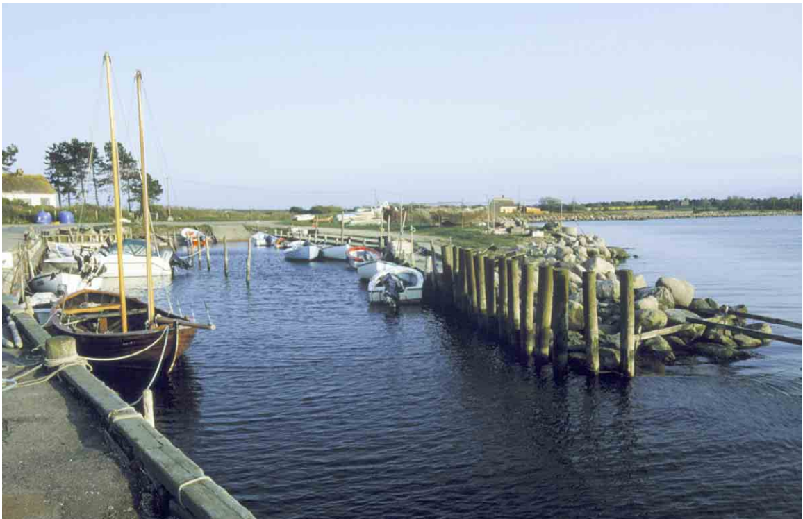
Ristinges havn ved Ramshøj ligger godt beskyttet for sydvestenvinden af halvøen ud mod Ristinge Hale og øgruppen Storeholm.

Kortlægning og registrering af kulturmiljøer