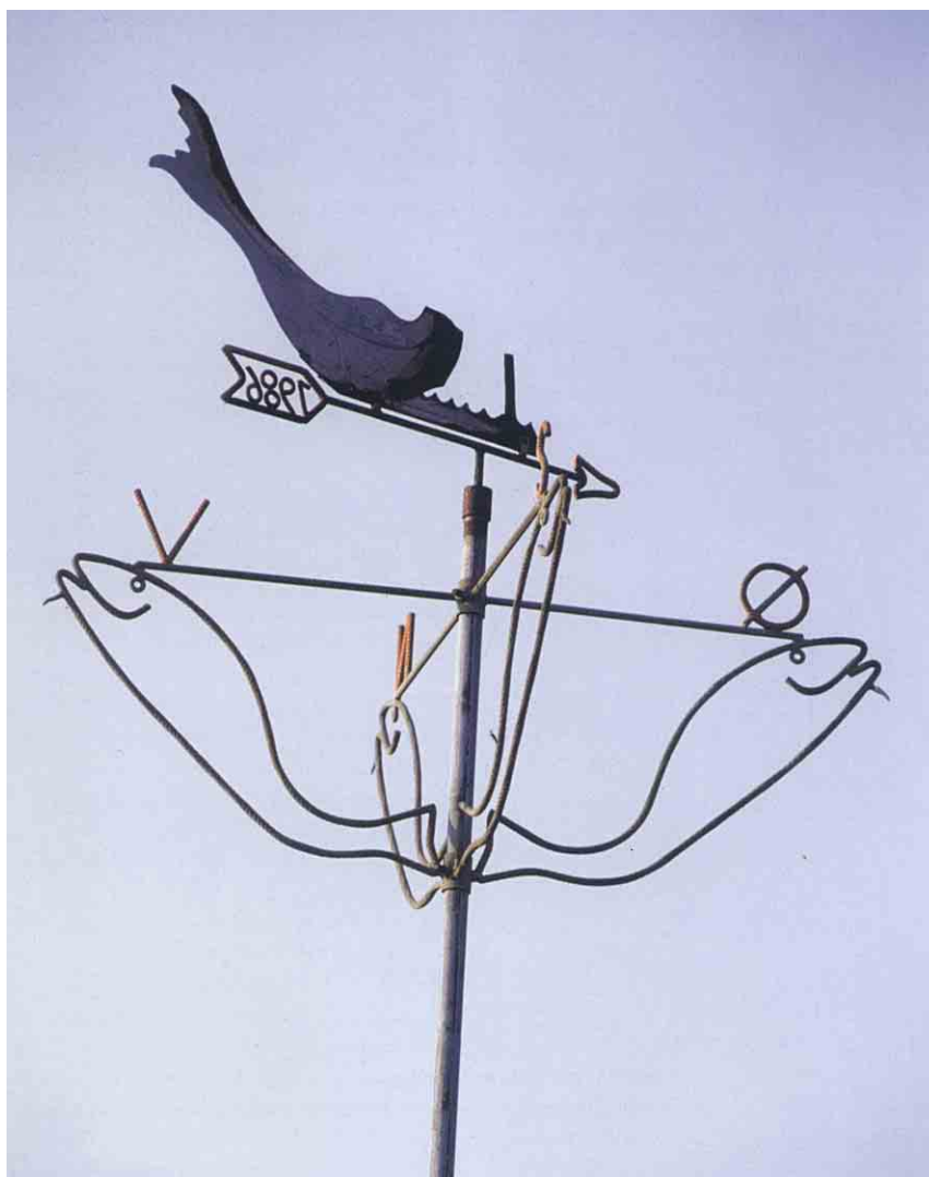
Langeland er et af de områder, hvor det blæser mest i Danmark. Vindfløj på taget af fiskerhuset på Ramshøj, Ristinge Havn.

På havnen ved Ramshøj findes et fiskermiljø med havnemole, fiskerhus og stejleplads. Et originalt og spændende kulturmiljø. Vindfløjen på fiskerhusets tag fortæller om den aktuelle vindretning.