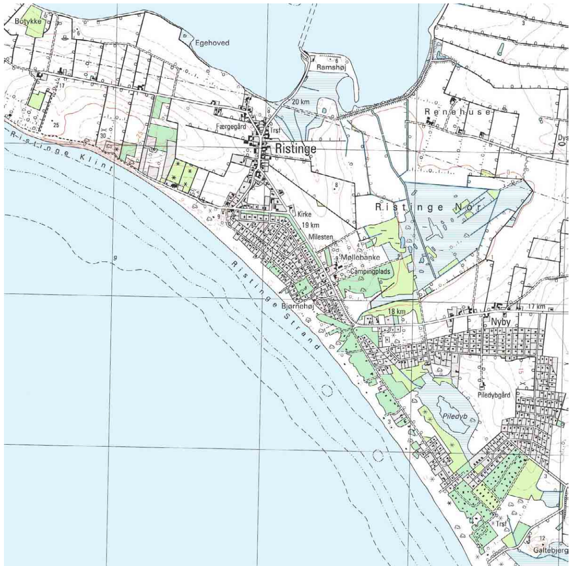
Ristinge, kortudsnit i mål 1:25.000

Kortlægning og registrering af kulturmiljøer