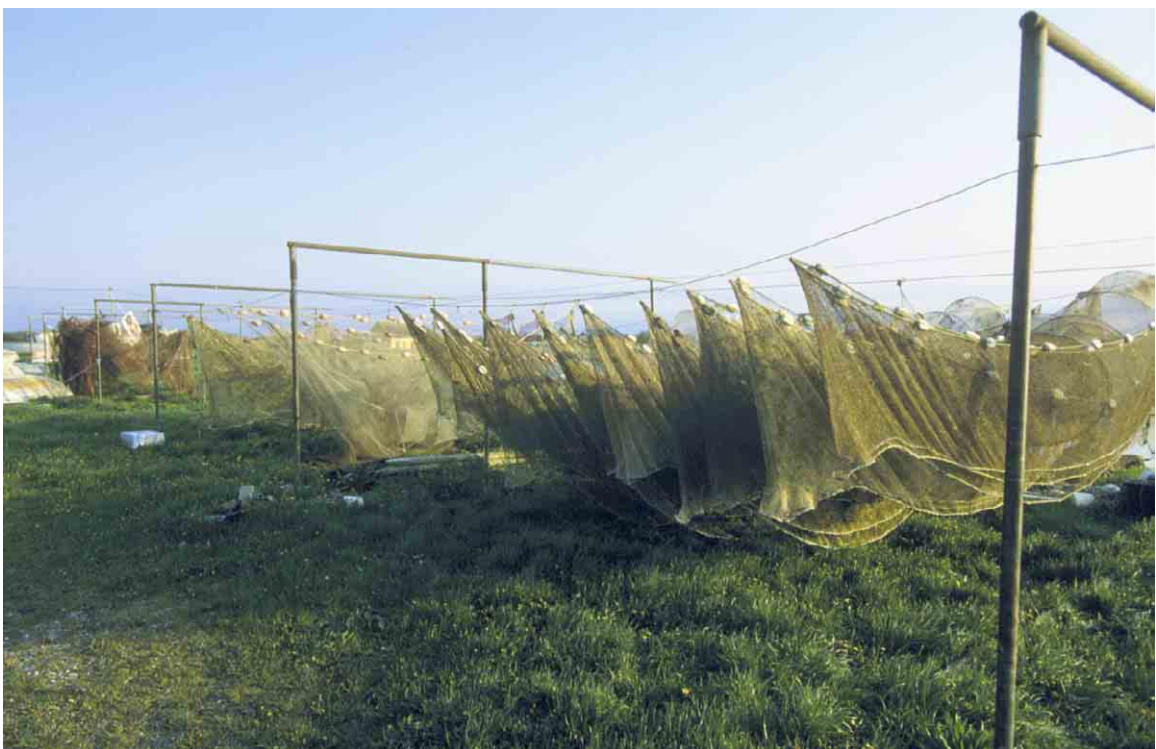
På stejlepladsen hænges fiskernes garn til tørre.