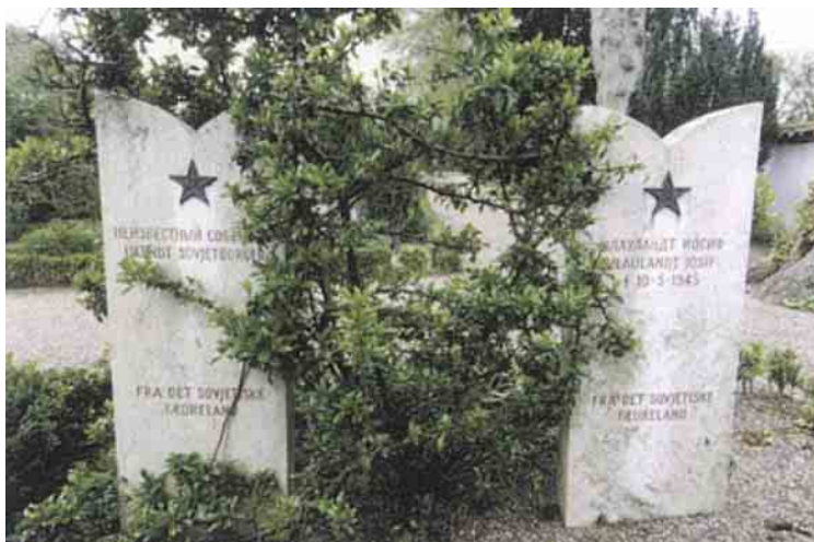
På Tranekær kirkegård ligger to af de russiske krigsfanger som strandede ved Påø Strand begravet.

Kortlægning og registrering af kulturmiljøer