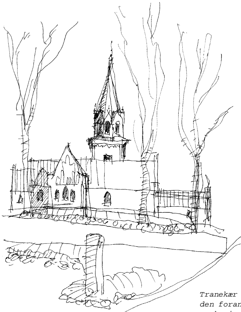
Tranekær kirke set fra den foranliggende parkeringsplads mod