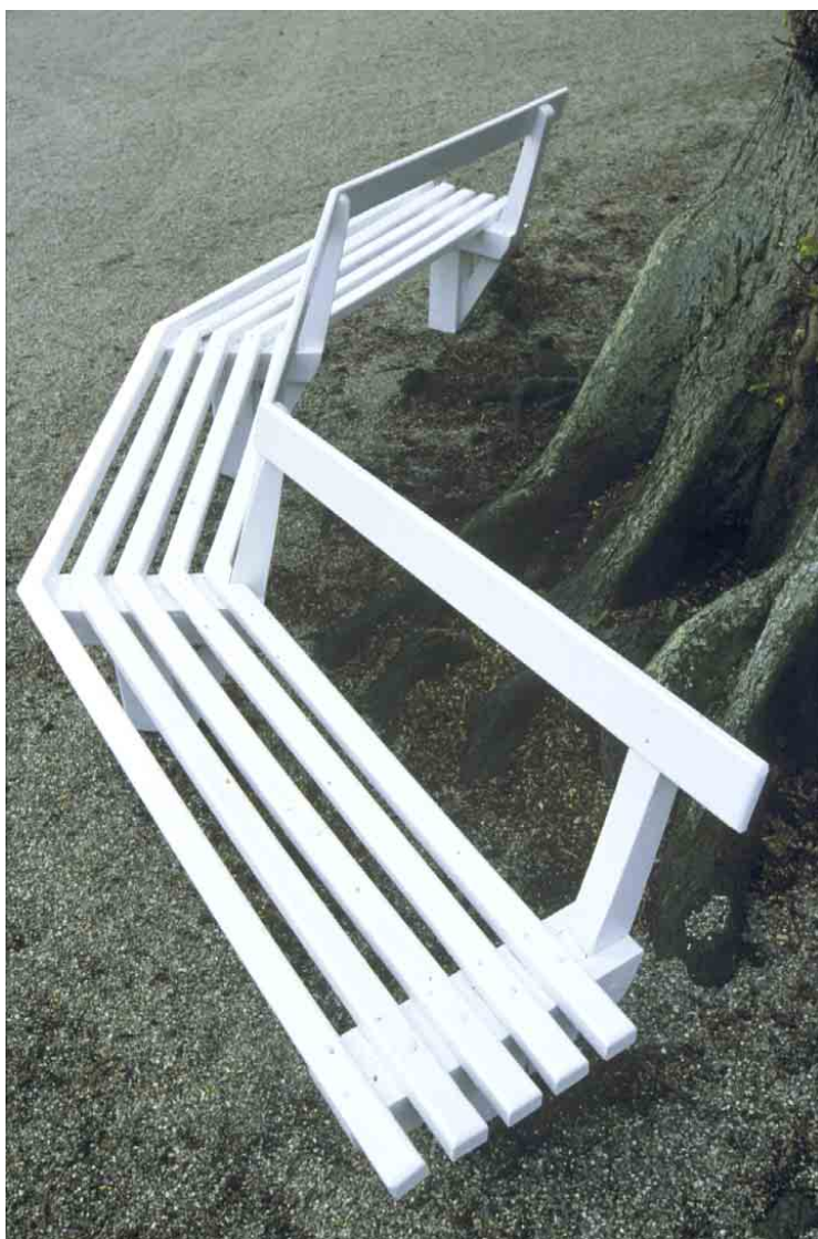
Kirkebæk ved roden af et af de store lindetræer foran kirken.