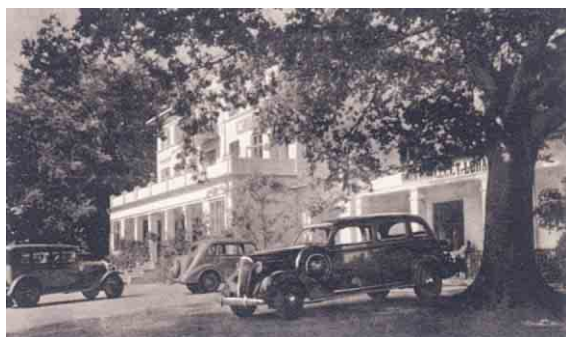
Det gamle fotografi giver et godt indtryk af det mondæne liv blandt datidens gamle badegæster. Foto fra begyndelsen af 1940'erne.

Inde i landet påkalder først og fremmest Tom Knudsensvej sig interesse på grund af de beskedne fiskerhuses enkle og stramme bebyggelsesmønster. Men også den ensomt beliggende Hov Kirke, tegnet af arkitekt A. H. Klein, er med sin nøgterne og præcise murstensarkitektur en god repræsentant for kirkebyggeriet i landets fattigste sogne i slutningen af 1800-årene.