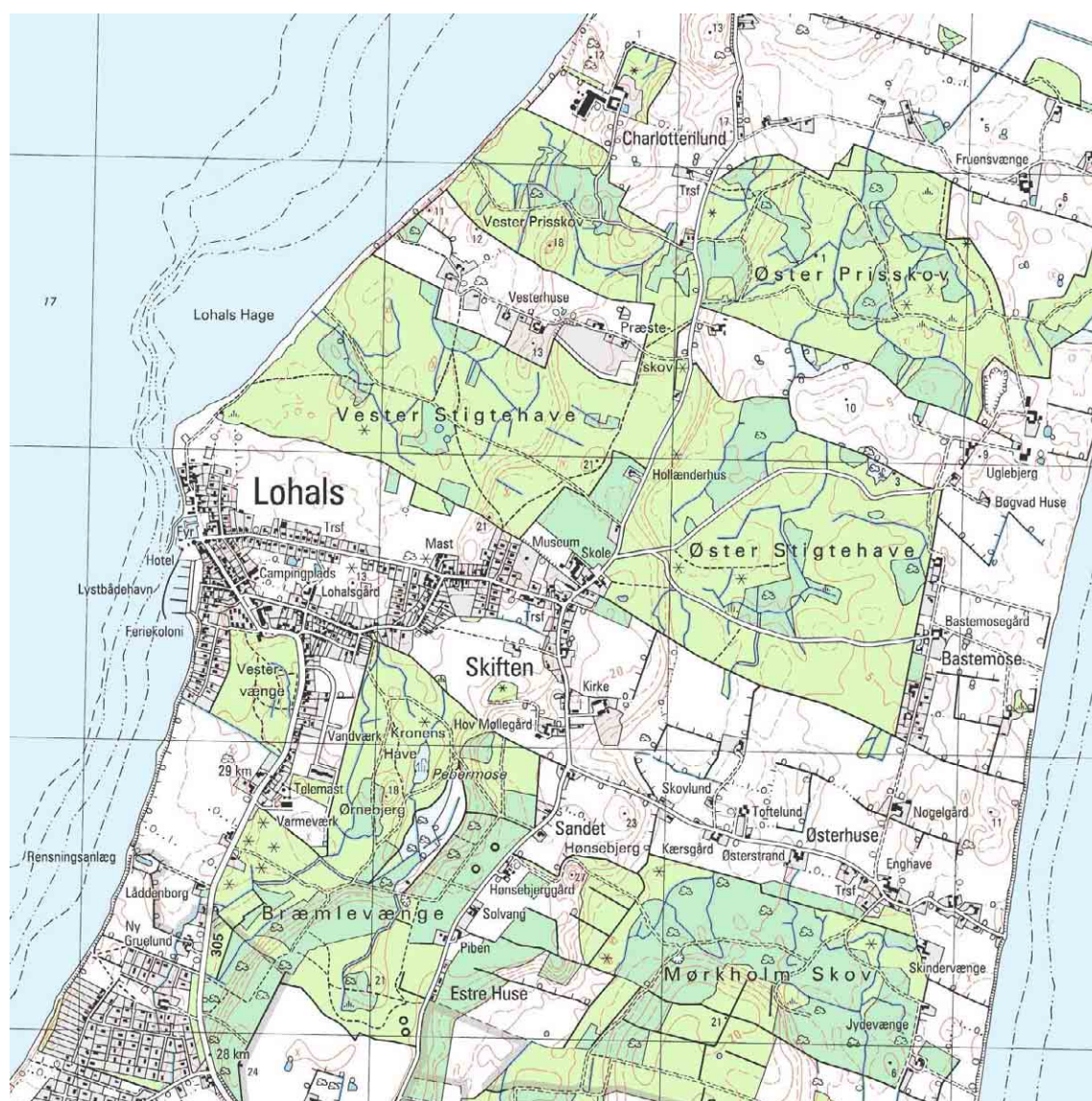
Lohals, kortudsnit i mål 1 : 25.000

Jordbunden i Hov sogn er mest svagt bølget, men bestrøet med kæder af hatbakker, der står med op til ti meter høje skrænter og flade topflader, som ligger i samme højde o. 20 m over havet. På nordøstspidsen findes Frankeklint på 14 m og med fyr og nordligere den lille, bratte skrænt Øren. Herfra og mod øst findes et stort marint forland med sommerhuskolonien Nordstrand eller Hov strand, Langelands mest kendte badestrand. Sognet udskiltes 1882 fra Snøde og Stoense sogne.