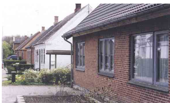
På Tom Knudsensvej er husenes placering stramt styret af vejbygge- linjen.