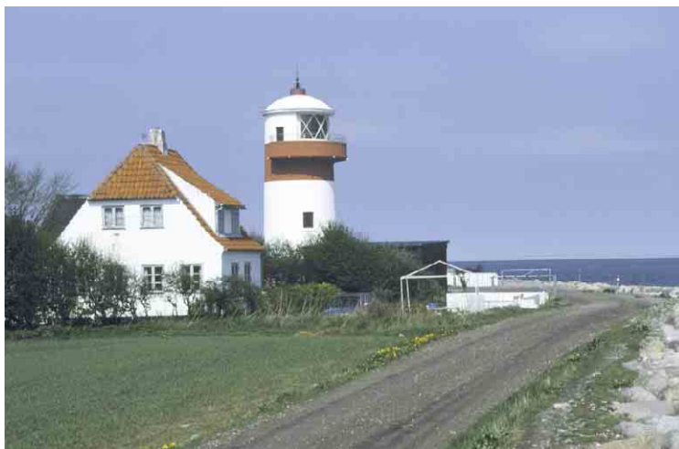
Hov Fyr med tårn og fyrmesterbolig.