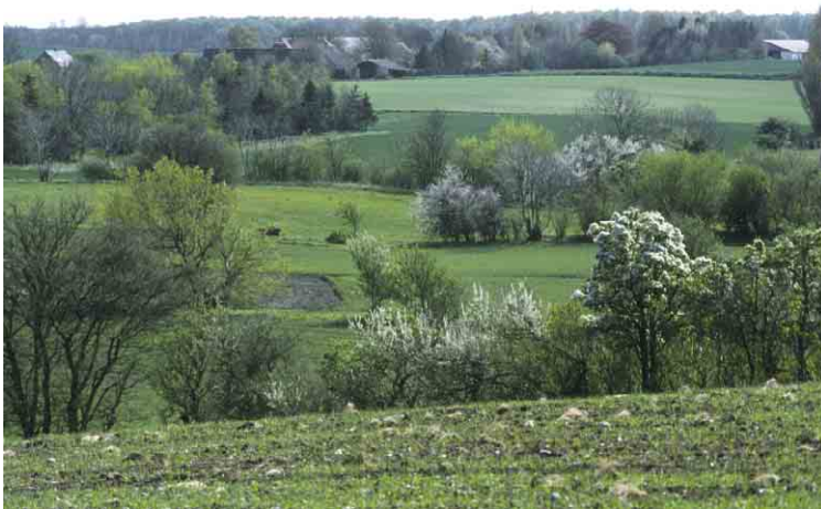
Hov's svagt bølgede bundmoræne er særlig tydelig aflæselig på grund af markskellenes beplantning.

Jordbunden i Hov sogn er mest svagt bølget bundmoræne og bestrøet med kæder af hatbakker, der står med op til ti meter høje skrånter og flade topflader, som alle ligger i samme højde ca. 20 m over havet. På nordøstspidsen findes Frankeklint på 14 m og med fyr og nordligere den lille, bratte skrænt Øren. Herfra og mod øst findes et stort marint forland med sommerhuskolonien Nordstrand eller Hov strand, Langelands mest kendte badestrand. Hov sogn er øens skovrigeste.