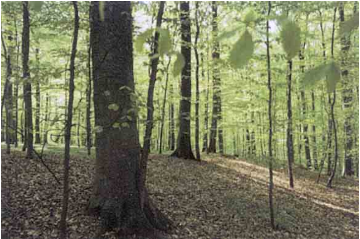
Lave volde og terasser i skovene på Hov angiver jernalderens marker. Som her i Vestre Stigtehave.