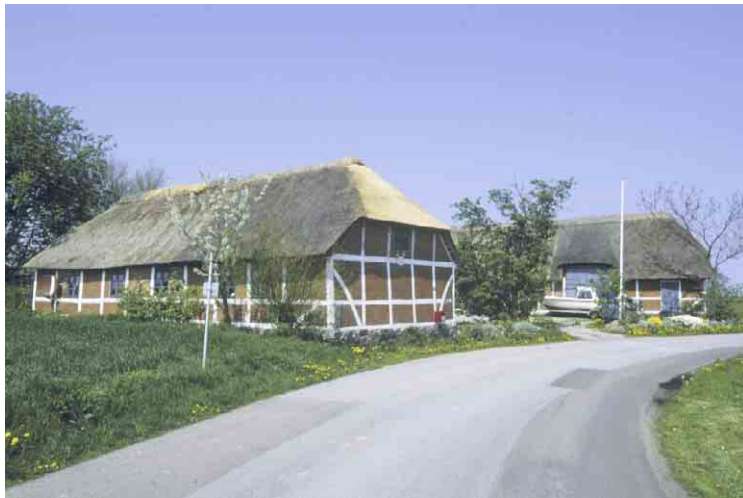
3-længet bindingsværksgård på Hovvej 99.

En særlig bebyggelse som påkalder sig opmærksomhed, er tilstedeværelsen af de to fyr: Hov Fyr og fyret på Frankeklint. Det sidste minder mest af alt om et ældre sommerhus og kan være lidt svært at få øje på. Hvorimod det første svarer til det, som vi forstår ved et rigtigt fyr med et kegleformet tårn i en markant rød/hvid bemaling og et tilhørende fyrmesterbolig.