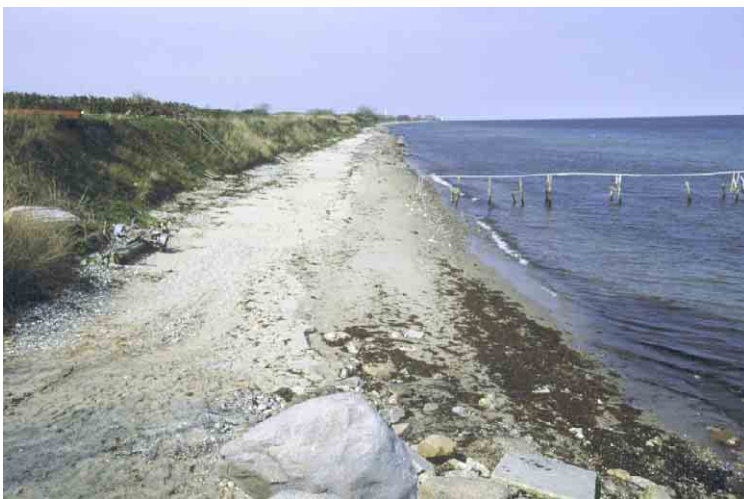
Udligningskyst ved Østerhuse Strand