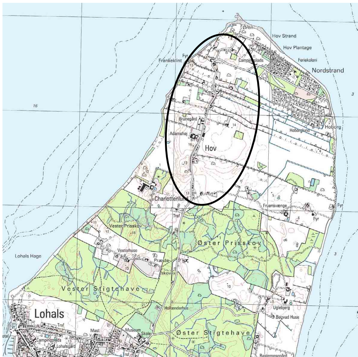
Hov, kortudsnit i mål 1:25.000

Kulturlandskabet på Hov adskiller sig fra det øvrige Langeland. I Østre og Vestre Stigtehave ses således stadig spor af jernalderbondens marker i form af lave volde og terrasser.