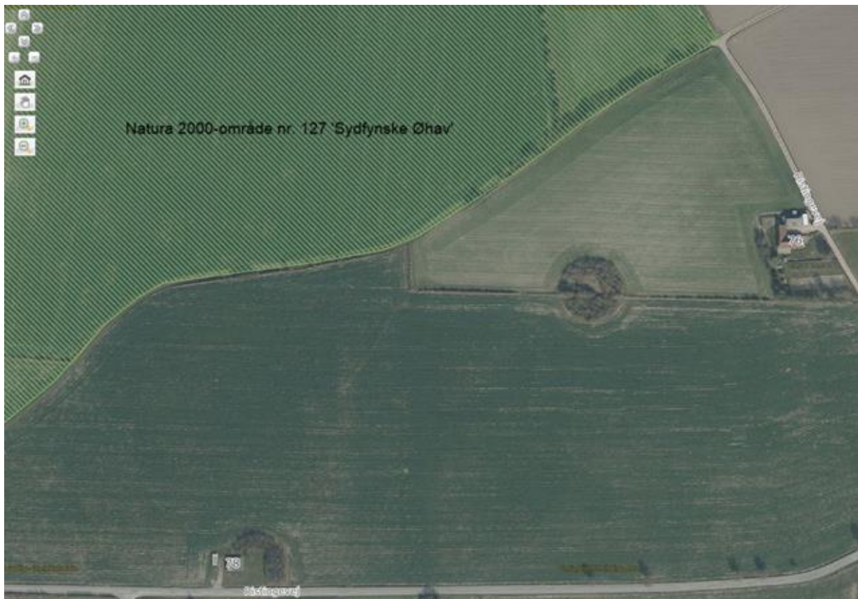
Natura 2000-områdets placering i forhold til Ristingevej 78 og 76, som angivet i ansøgningsmaterialet.

Det er derfor kommunens samlede vurdering, at det ansøgte, ikke i sig selv eller i forbindelse med andre planer og projekter kan påvirke Natura 2000-området væsentligt.